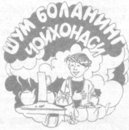
ШУМИ БОЛАНИНГ ЧОЙХОНАСИ