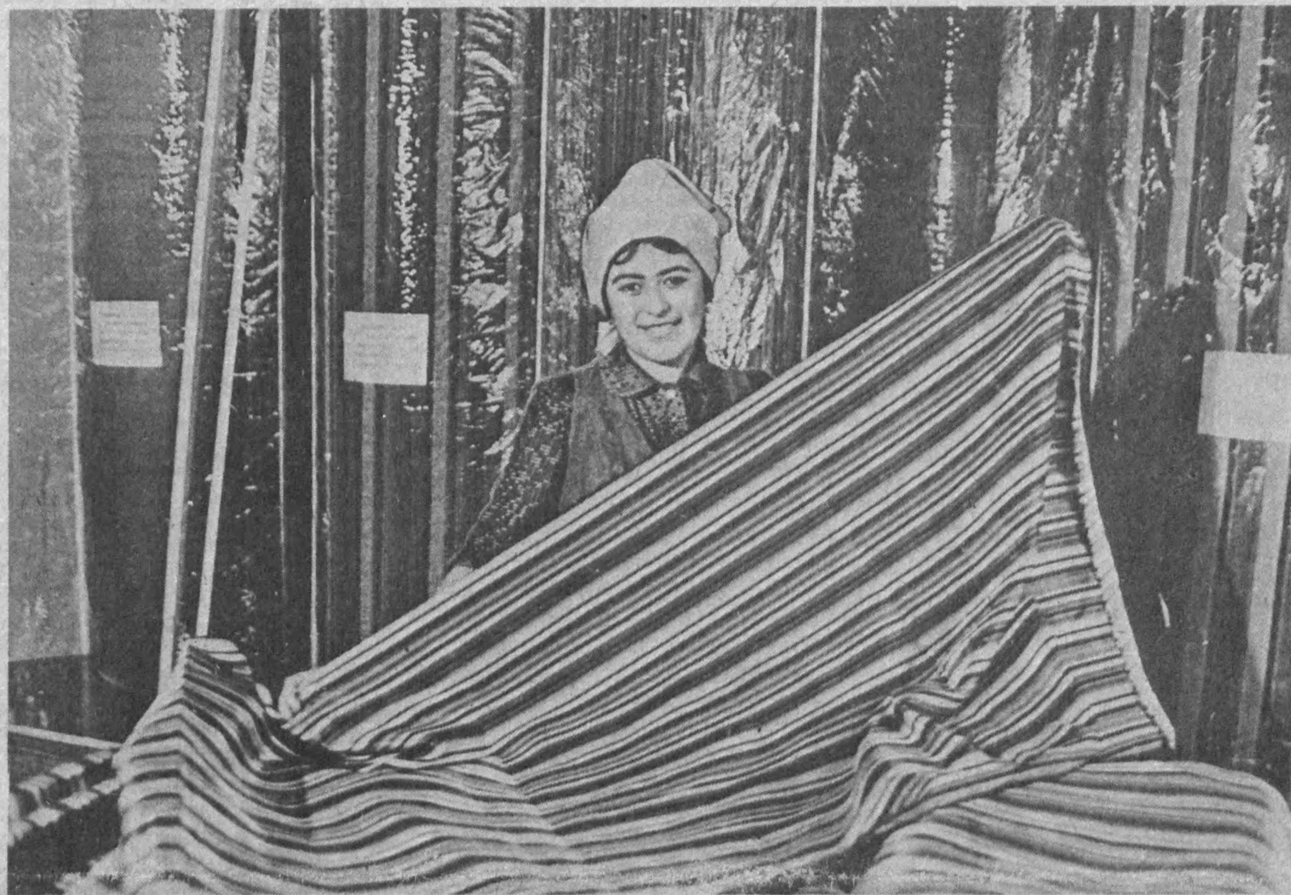
Избоскан ноҳиясидаги шойи тўқиб фабрикасида халқ истеъмоли буюмлари ишлаб чиқариш ҳақиқат кўлайиб бормоқда. Корхонада бунинг учун барча имконият ва резервлар ишга солинмоқда. Цех ва участкаларда усқуналардан унумли фойдаланишга, ҳўжалик юртишнинг янги шакллари жорий қилиб, хом

Т. ҲАМИДОВ, «Совет Ўзбекистони» жамоатчи муҳбири.