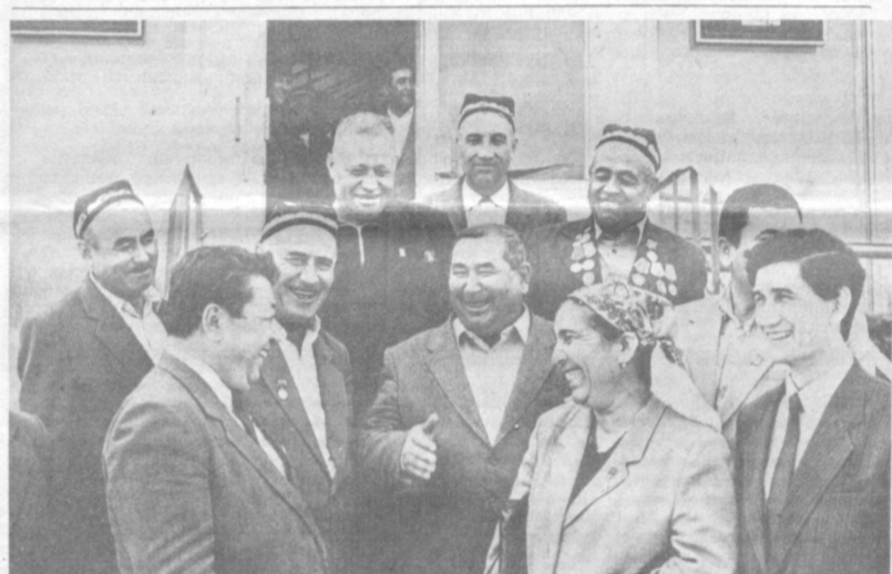
СУРАТДА: курултой қатнашчиларидан бир гурупа.