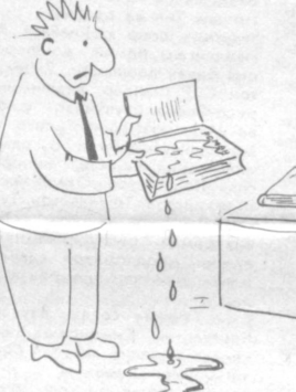
Рассом Иброҳим ЖИЯНОВ