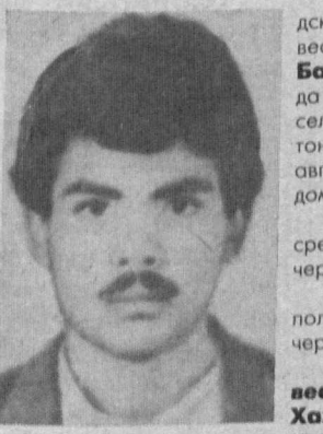
Отделом внутренних дел Самаркандского райохикимията Самаркан-