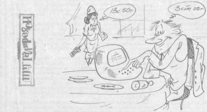
Рассом Шухрат СУБХОҶОНОВ