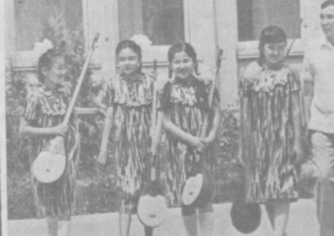
«Литературная газета», 1989 йил, 21 июнь соҳи

Юрий Гагарин номидаги Тошкент тумачилар ҳақидаги маълумотлар.