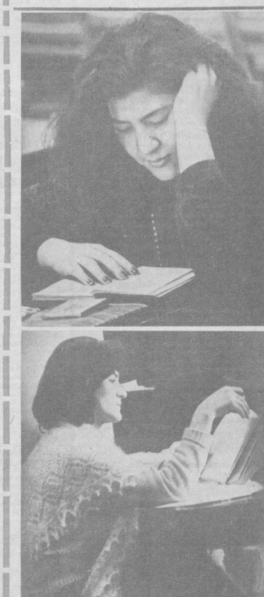
Синов дамлари.