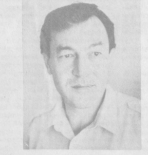
Сайдулла ҲАКИМ ОНА ТИЛИМ Дўста дўсту дугона тилим, Бегонага бегона тилим, Бешигимда ягона тилим, Она тилим.

Она тилим. Қизларидек ифбатли тилим, Қардошига иззатли тилим, Тилим, тилим ва яна тилим Она тилим. Улус тилим, элат, халқ тилим, Давлат тили бўлса ҳақ тилим, Навойига зор, илҳақ тилим Она тилим. Ота бўлиб отланган тилим, Она бўлиб шодланган тилим, Бола бўлиб ёдланган тилим Она тилим.