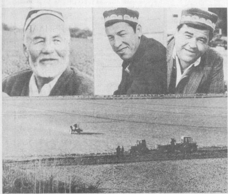
Наманган туманидаги «Гайрат» жамоа ҳужалиги аъзолари бултур барча соҳаларда юкори кўрсаткичларни намойиш қилишди. Утган йили муваффақиятларини мустақамлаш мақсадида жамоа деҳқонлари баҳорги юмушларини уюшқоқлик билан бошлаб юбордилар. Пахтага ажратилган майдонларга чигит экин билан бирга картошка, сабзавот экинлари парваришига ҳам эътибори кучайтиришган.

Биз томонларда баҳор таровати, файзи узгача бўлади. Тоғлар ям-яшил майсалар, қизил-қизил долларга бурканиди. Жилгалардан қуш ташаббатан сув одамга ҳузур бағишлайди, узини текти, бардам ҳис этади. Исмаюк, яшилдан тайёрланган чучвара, сомсалар таъми оғизда қолади. Буни қуриб жаннатмақом юртда яшаётганимизга шукроналар айтаемиз.