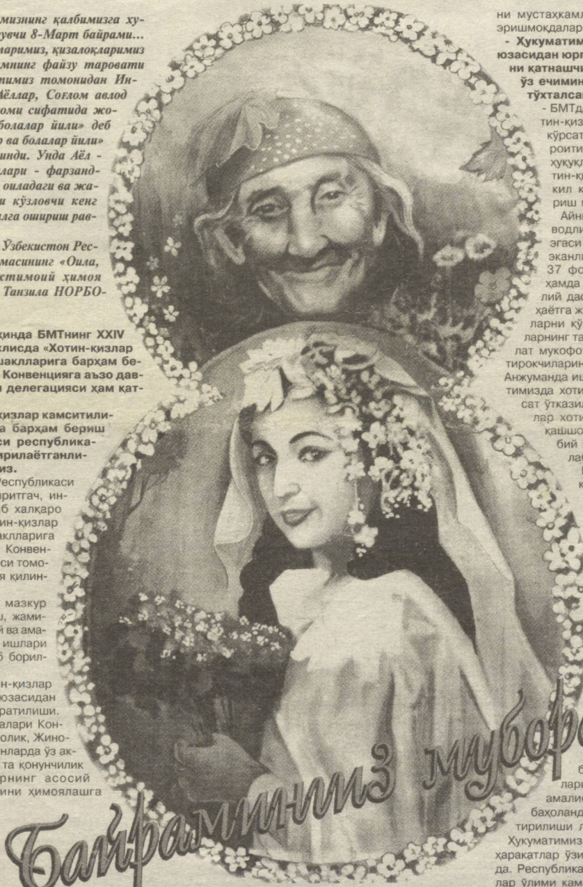
«Умр йўли». Рассом М. АШУРМАТОВ асари асосида коллаж.

биқ этилишини назорат қилувчи махсус Маслаҳат-таҳлил Кенгаши ташкил этилган.