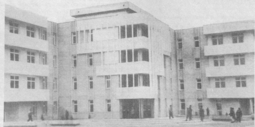
• Маъмурий бинонинг сиртки кўриниши.