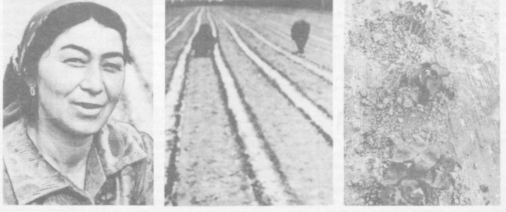
Учи туманидаги Алишер Навоий номли жамоа хўжалиғининг 8-бригадаси миришкорлари жорий йилде 22 гектар майдонда пайка остига чигит қалаб, тулик ундириб олдилар. Шу кунларда бригаде даладарида ниҳолларға ишлол бериш қизғин тус олган. СУРАТЛАРДА: 1. Бригаде аъзоси Муборак Раззоқова. 2. Ниҳолларға ишлол берилаётган пайт.