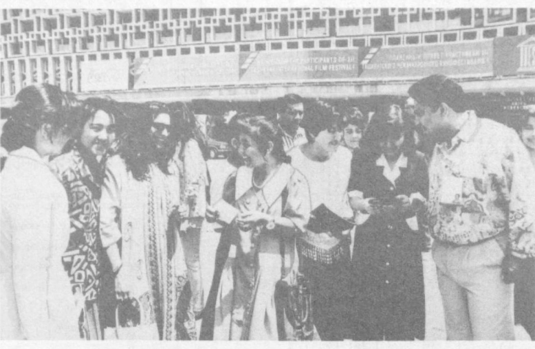
СУРАТДА: кино юлдузлар билан муҳлислар учрашуви.