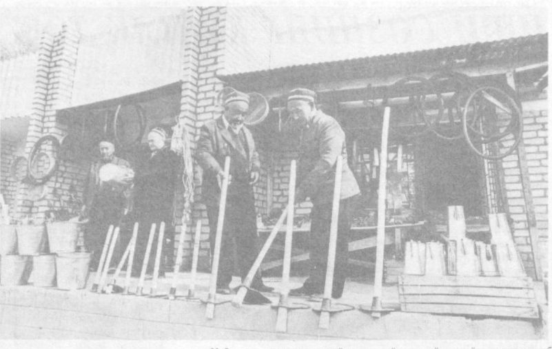
Илбосдан туманида маънавий ҳизмат кўрсатиш йилдан-йилга яхшиланиб бормоқда. Маънавий ҳизмат кўрсатиш уюмлари таркибда 387 та қорхона ва ноҳиялар бўлиб, улари 720 ҳодим меҳнат қилади. 2000 йилгача муҳалладан дастурда уюлма фаолиятини тақомиллаштириш ва кенгайтириш мақсидига 5 миллион сўмлик биноларни на 123 та янги иш ўринлари ташқил этиш кўзда тутилган. СУРАТДА: Пойтуз бозоридagi миллий ҳунармандчилик буюмлари тайёрлаш расталари.