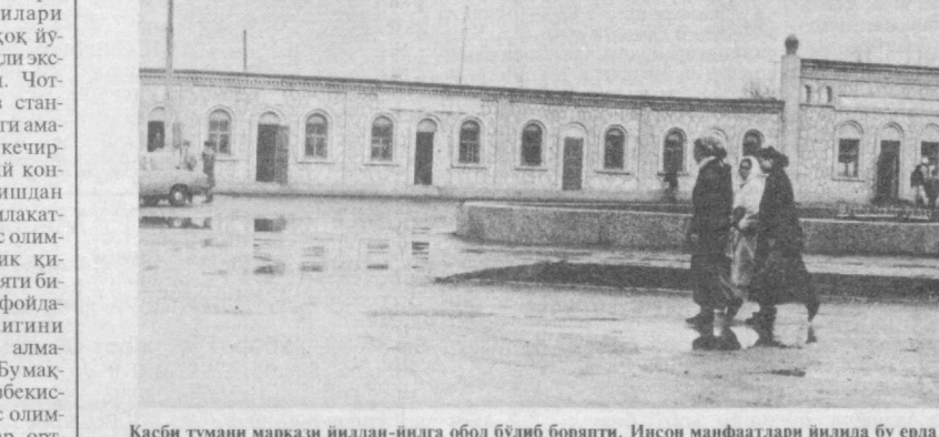
Касби тумани маркази йилдан-йилга обод бўлиб борапти. Инсон манфаатлари йилида бу ерда қулаб турар жойлар, маданий-маиший хизмат қурсатин шохобчалари қурилиб фойдаланишга топширилмокда. СУРАТДА: туман марказидаги илмий меъморийлик аънавалари руҳида барпо этилган иморатлар.