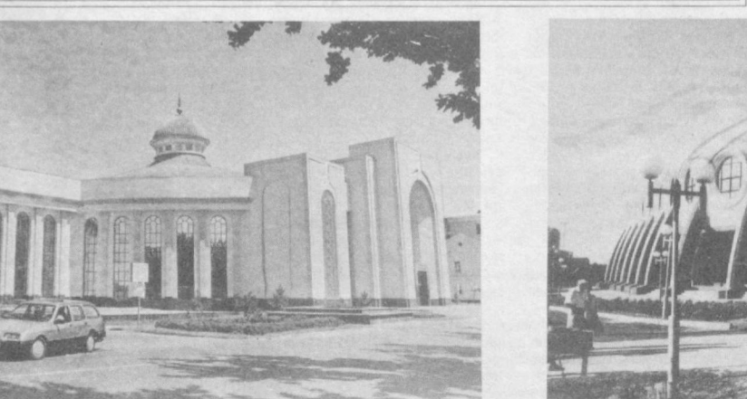
Мамлакатимиз пойтахти кун сайин чирой очмоқда. Мустақиллик шарофати ила Тошкент жаҳондаги энг сўлим шаҳарлардан бирига айланмоқда.

Шуни алоҳида таъкидлаш керакки, мамлакатимизда қарор топаятган тинчлик-осойишталик, иқтисодий ислохотларни амалга оширишдаги изчиллик, халқаро масалалардаги қатъият Узбекистонни дунё миқёсидаги обрўсини оширмоқда.