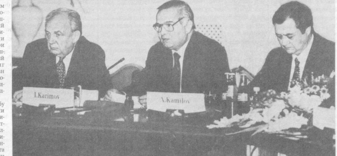
Анжуман 16 сентябрь куни ўз ишони давом эттирди. (ЎЗА). Суратда: халқаро конференцияда.

бининг уринбосари Иброҳим Солиҳ Бақр, Европа иттифоқи вакили — Голландия Ташқи ишлар вазирлиги ядровий муаммолар ва ядро қуролини тарқатмаслик бўлими бошқаруви уринбосари Паул Уилке сузга чиқиб, ушбу икки ташкилот Марказий Осиё мамлакатларининг минтақани ядро қуролидан холи зонага айлантириш борасидаги ташаббусини қўллаб-қувватлашни маълум қилди. Таъкидлаш керакки, ушбу анжуман дунёнинг турли мамлакатларида катта қизиқиш уйғотди. Бунга давлатлар раҳбарлари, қўллаб-қувватлаш томонидан конференция иштирокчилари номига келатган мактублар эркин мисол бўла олади. Конференциянинг биринчи кунда ядро қуролидан холи зоналарни барпо этишда халқаро тажриба ҳамда минтақавий хавфсизлик мавзусида амалий сессиялар бўлиб ўтди. Унда БМТ хавфсизлик кенгашининг доимий аъзолари