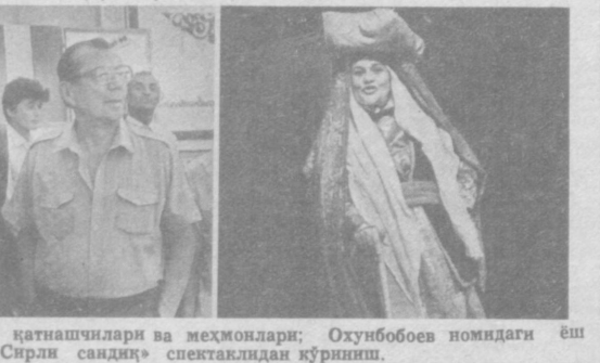
СУРАТЛАРДА: фестиваль қатнашчилари ва меҳмонлари; Оқубобоев номидаги еш томошабинлар театрининг «Сирли сандиқ» спектаклидан кўрникни.

театр Арбоблари уюшмаси билан кўрник мумкин. Анжуман муносабати билан бўлиб ўтган маъбуот конференциясида жумҳурият Маданият министрлиги ва театр Арбоблари уюшмаси раҳбарлари журналистларини қизиқтирган барча саволларга жавоб қайтардилар. 26 сентябрда яқунлаштирилган анжуманининг кун тартибидан ажойиб тадбирлар ўрин олган. Ҳар бир спектакль