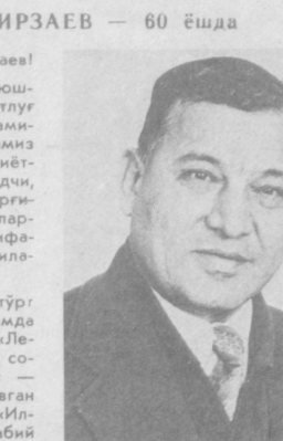
Сиз илкий ишн педагогик ва жамоат ишлари билан кў...