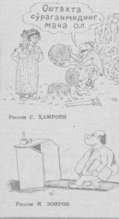
Рисом С. ҲАМРОЕВ

Мушугим индамай туради ЯХУДИЙ ХАНДАЛАРИ — Бошининг нега боғлаб олдинг?