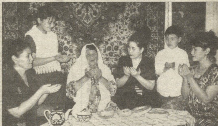
Етти фарзанд - бир ўғил, олти қизни оқ ювиб, оқ тараб вояга етказган Дилбархоннинг оналари Холбуви ая ҳар гал эл-юртга тинчлик-омонлик тилаб дуога қўл очинди.

ми, ўғил болами, аввал хунар ўрганиши керак. Хунарни катта-кичиги бўлмайди. "Меҳнат одамни ва оламни кутқаради", деган фикрдаман. Бир куни олдимга ёш келинчак йиғлаб келди. Уни