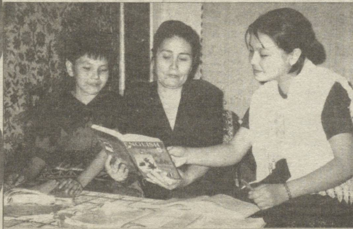
Уйда - фарзандлар билан китоб муталаа қилиш гаштига не етсин...

Зулфия МўМИНОВА