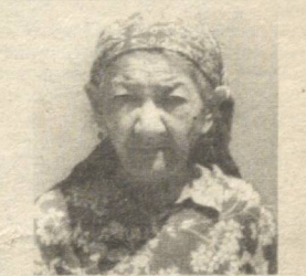
Сунгра қаламчадан кўкартирилган атиргуллар тепасига бориб, алланималарни гапларга эдилар. Ховлимиз гулзор эди. Хар битта гул ўз тарихига эга эди. Онажоним гуллар билан "гаплашиб", "сирлашиб" бўлган, бизларни уйғотар эдилар. Мен ҳамон ўша гулларда онажоним хидларини туйман. Хар тонгда худди гуллар орасида онажоним тургандек. Ишдан толиқиб қайтган дамларда гуллар олдига бориб, бир оз меҳнат қилсам, куч-қувват оламан. Мен бу сабоққа - гулларга меҳр қўйиш сабоғига умрим охиригача содиқ қолишга уринаман.

Отам ишга кетган пайтларида онажоним менга рўзномаларда чиққан кичикроқ мақолаларни ўқитиш билан бир вақтда Қуръони Каримдан бир неча оятларни ҳам ёдлатдилар. Кариндошимизникида маърақа бўлиб қолди. Мен 3 ёшда, онажоним 6 ёшда эдилар. Буваимиз ёнида ўтириб, онамиз ёдлаган оятларни ўқидик. Бу холдан хатто отам ҳайрон бўлдилар. Чунки онажоним бизларга илмни ким кўрар учун эмас, балки ҳеч ким йўғида, вақтни бекор кетказмаслик ниятида ўргатар эдилар. Онажонимда риёкорлик йўқ эди. Доим: "Сўзинг ҳам, қадамнинг ҳам тўғри бўлсин", - деб таъкидлардилар. Баъзан олий маълумотли ота-оналар фарзандларини ўқитишга эътибор бермай, "Бу мактабнинг сазифасига кирди, мен кийинтириб, едирсам бўлди", - дейишган пайтда онажонимнинг, "Кийимларинг одми бўлсада, билимли бўлгин, сўзинг ширин бўлсин, ёлғон гапирма", - деган насиҳатлари беҳиётёр ёдимга тушаверди. Онажоним камтарин, камсуқум эдилар. Оддий кийинишининг устига, зийнатларга унчалик эътибор қилмас эдилар. "Инсоннинг зийнати - унинг