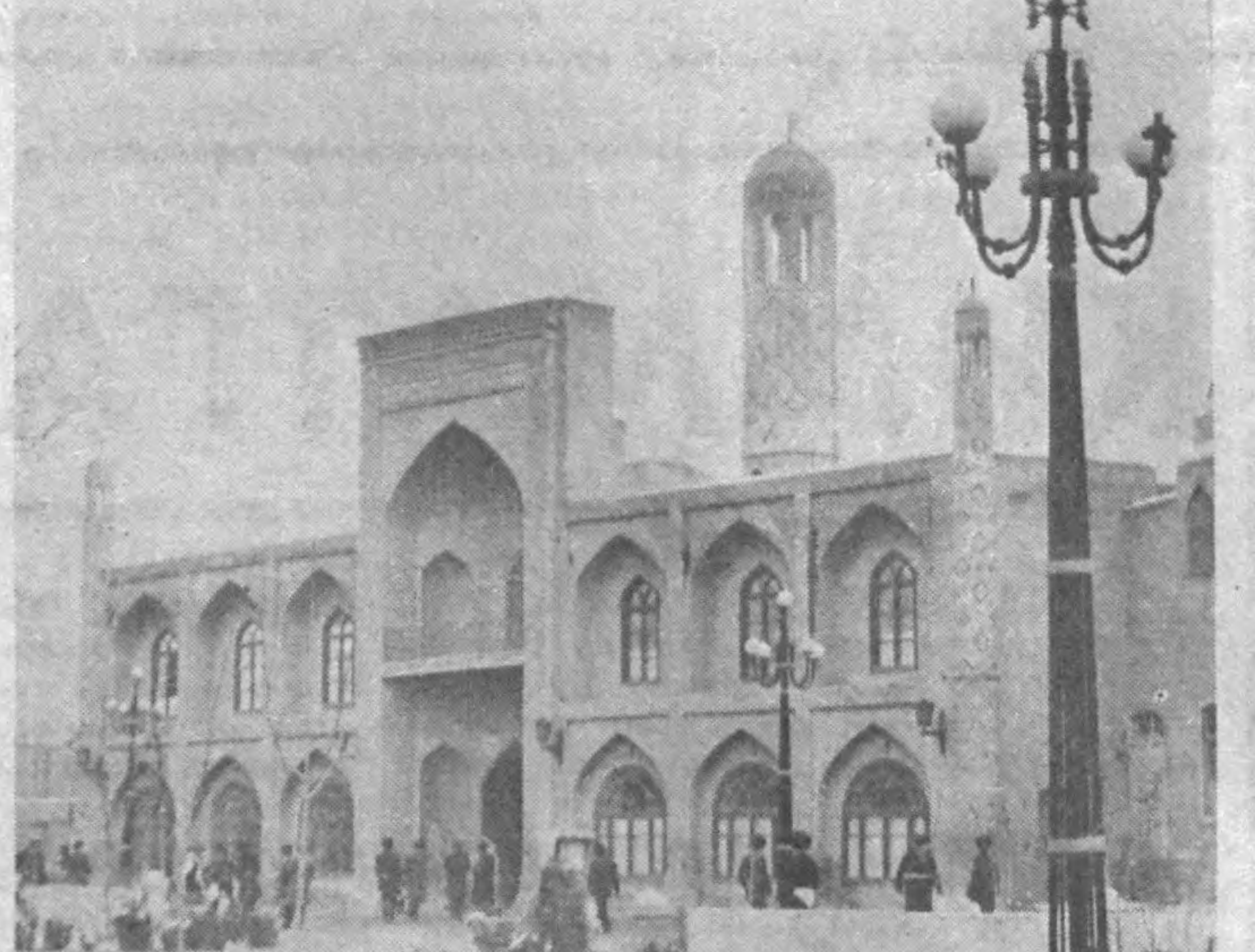
Юртимизда муқаддас урф-ода, кадрларимизнинг тикланаётганлиги фўқороларимиз қалбларини эҳси қувончга тўлдирмоқда. Кекас авлод бугунги ёшларга яхши ният мўназмили маслаҳатлар беришмоқда.