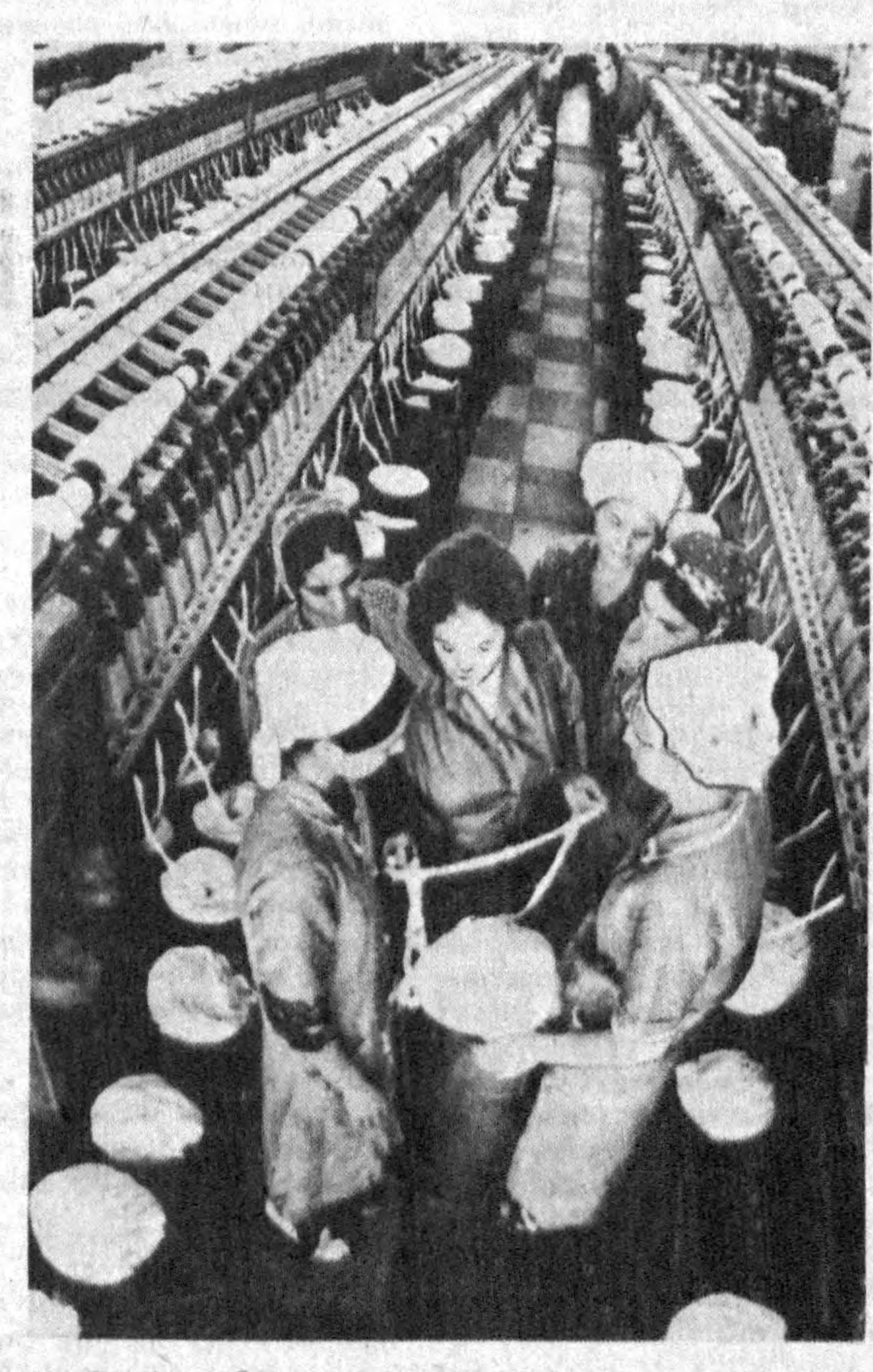
● Ашхобод шаҳридаги Держинский номили ип-газлама комбинати республикадаги энг ирриқорхоналардан бири...