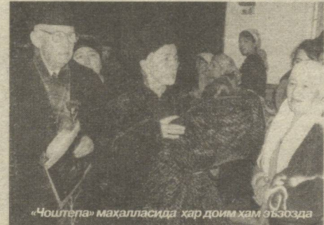
«Чоштепа» маҳалласида ҳар доим ҳам ётқозда