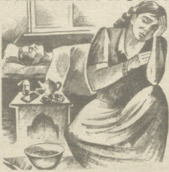
Сизга айтмоқчи бўлганларим

дилар. Лекин мен кетишга мажбур эдим. Бу ерда менинг энг яқин дўгоналарим Саодат билан Муҳтарам бор эди, улардан ҳеч ҳам ажралгим келмасди. Лекин, на илож. Охири 2002 йил 1 февралда бу ердан кўзларимда ёш билан бўшаб кетдим. Мен Қобил ака, Абдуборий ака ва Зухриддин акадан жуда ҳам миннатдорман. Улар мени оёққа тургазишди. Айримни касалхонага ётқизадиган бўлсам, улар менга ёрдам беришди ва барча дори-дармонларини ўзлари беришди. Мен аҳмоқ эса худди юзларига оёқ қўйгандек бўлиб қолдим. Лекин мен буни атайлаб қилмадим. Ҳозир Қобил акам ўша ТошМИДаги касалхонада даволанаптилар. Уларнинг касалига мен ўзим-