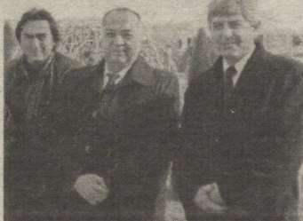
Суратлар муаллифи — М. Мирсодиқов