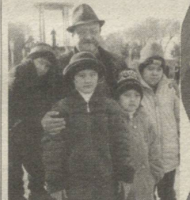
Ўзбекистон халқ артисти Эркин Комилов фарзандлари билан сайлда.

Йиллар давомида юртимизда эъзозланган, муқаддас Курбон Ҳайити байрамини бу гал ҳам ўзгача бир шукуҳ билан кутиб олдик. Мусулмонлар тарихида асрлардан буён ўрин тутиб келган бу муборак айёмда ҳар галгидек анчагина савобли ва эзгу ишлар қилишга ҳам улгурдик. Байрам баҳона кўчаларимиз, яшайдиган гўшаларимиз яна бир бор саришталанди, қутлаш баҳона маҳалламиздаги қарияларимиз, беморлар ва яқин қариндош-уруғларнинг ҳолидан хабар олдик.