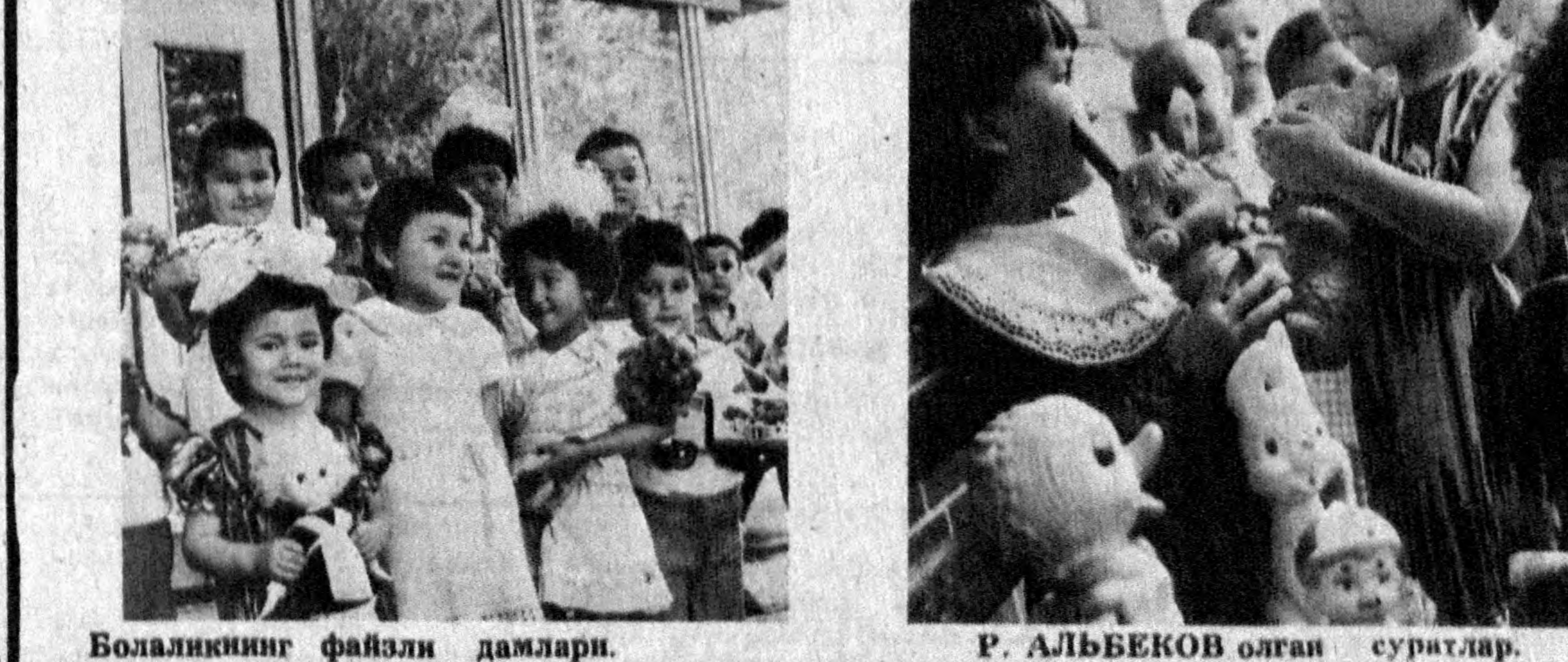
Болаликнинг файзли дамлари.