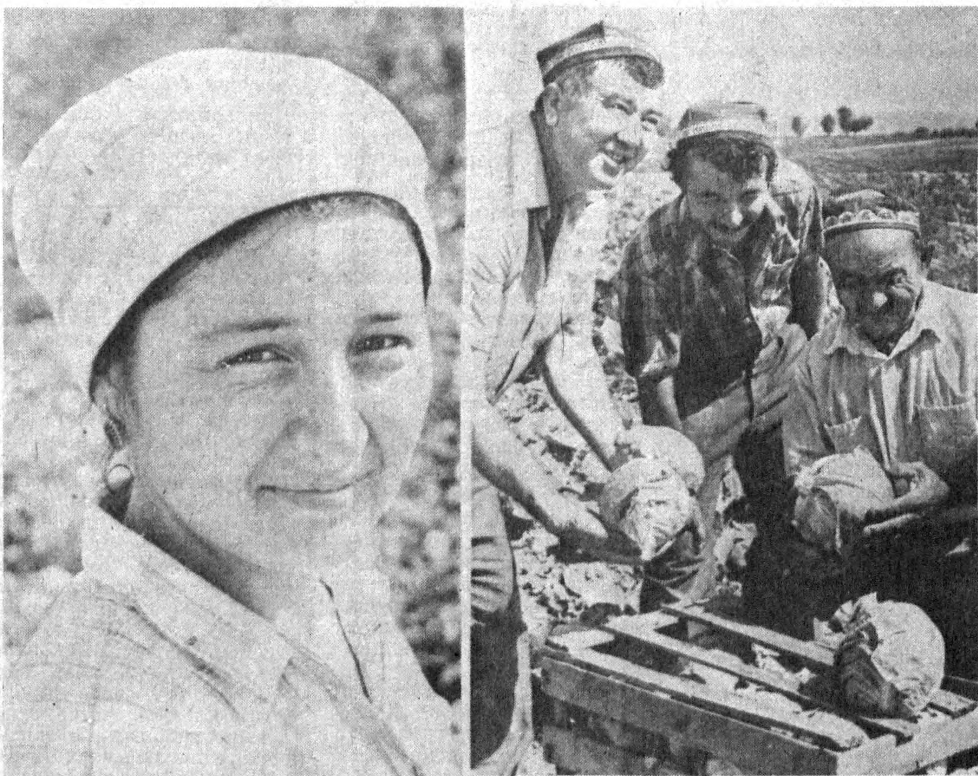
Шу кунларда Тошкент районидagi А. Навоий номли жамоа хўжалиғи деҳқонлари эл дастурхонига кўллаб ибиз, қарам ва бошқа маҳсулотлар жўнатишмоқда...