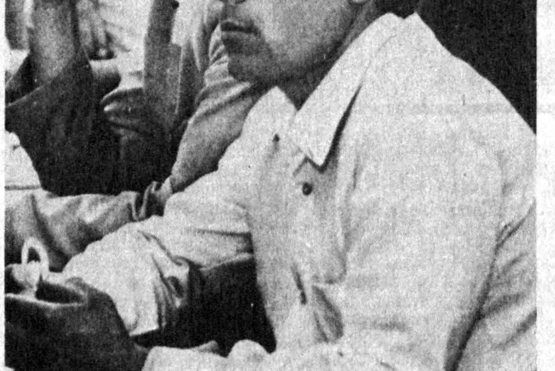
Ўн иккинчи чақириқ Ўзбекистон ССР Олий Кенгашининг бешинчи сессиясида.