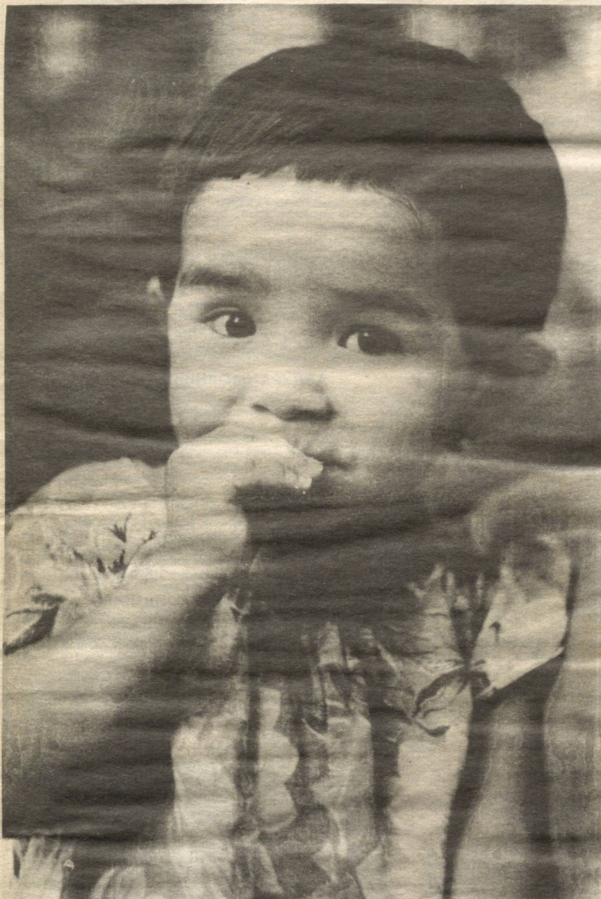
— БИР НИМА ДЕМОҚЧИДИМ