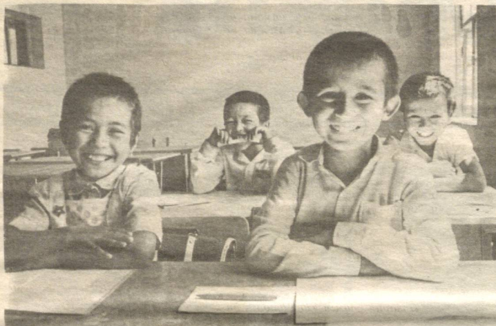
— БИЗ ДОИМО ШУНДАЙМИЗ