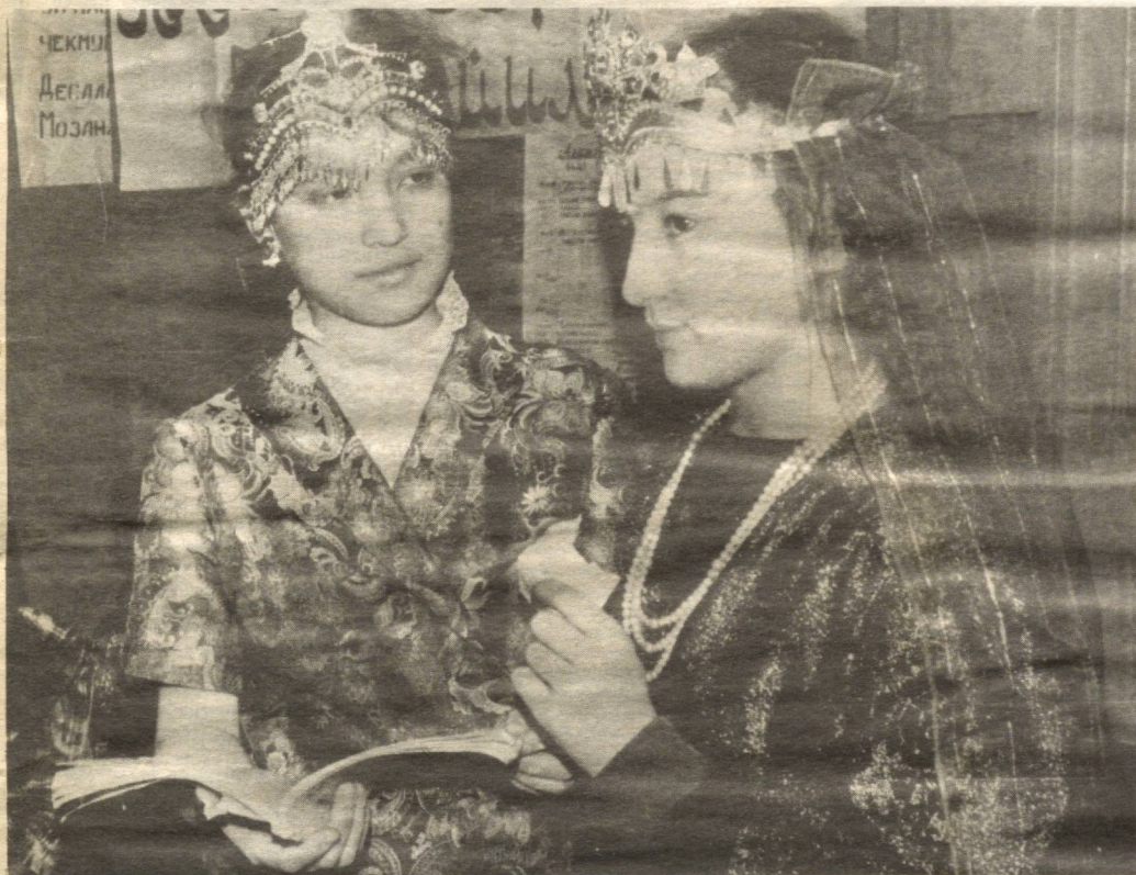
НАФОСАТГА ОШНО ҚИЗЛАР

Маъноси: Эй бор Худоё ушбу рўзамни фақат сенинг учун тутдим ва сенга иймон келтирдим ва сенга таваккал қилдим ва сенинг берган ризқинг бирлан ифтор қилдим. Эй гуноҳларни афв қилувчи Аллоҳ! Сен менинг аввалги гуноҳларимни ва охириги гуноҳларимни кечиргин ва ёрлақгин.