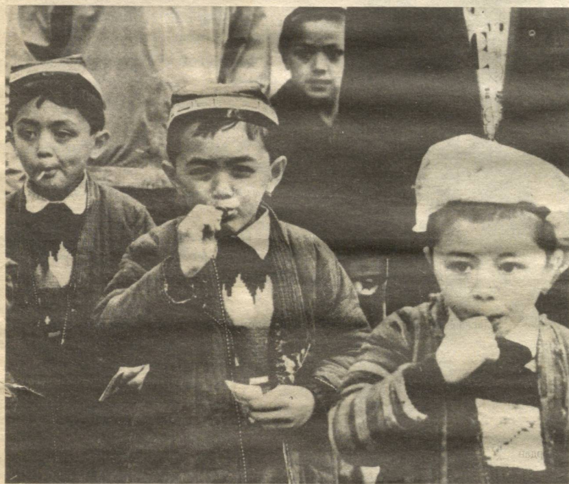
Хўроққанднинг мазасини биздан сўранг!