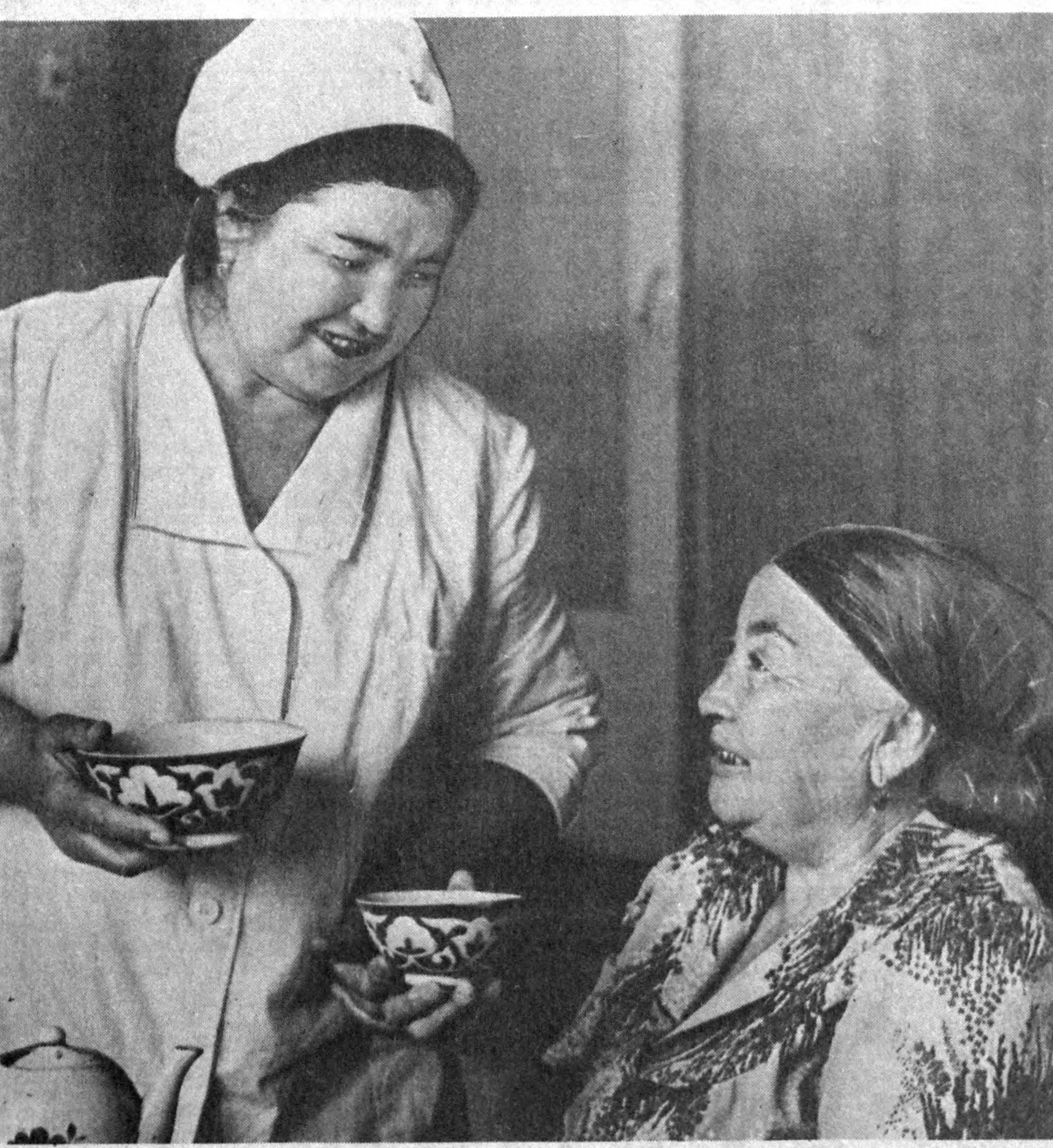
Суратда: Комила опа Нури Нисзова хонадониде.

Х. СУЛТОНОВ, «Совет Ўзбекистони» махсус муҳбири.