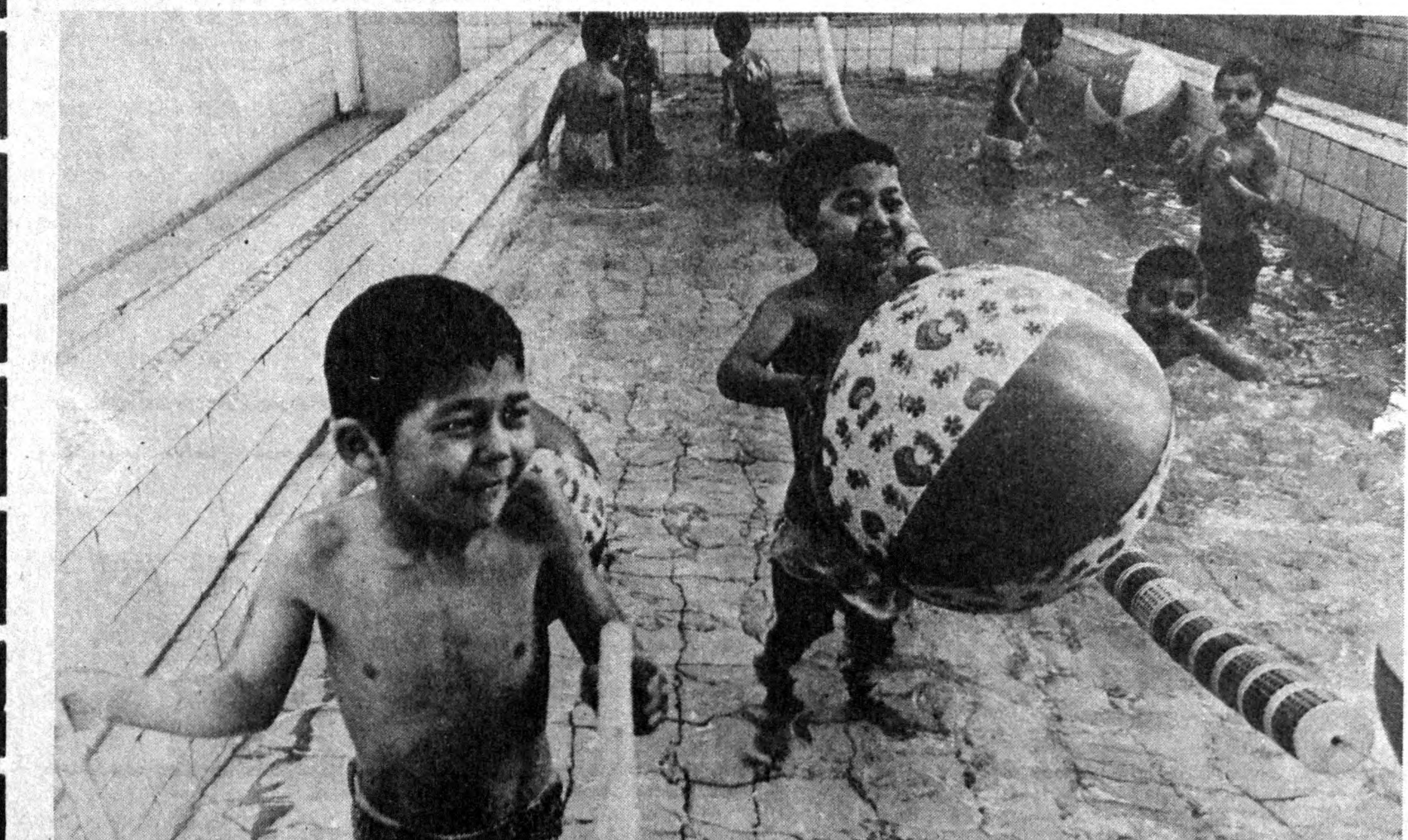
Эз чилпасида суя қўйида айраша инма етсин. Тўрашўрғон районидagi «Умид» болалар боғчаси кичикитойлари учун ана шундай қулайлик яратилган. «Ширинлик» комбинати қараш-ли бу боғчада 360 нафар ўғил-қиз тарбияланмоқда. СУРАТДА: болалар чўмиллаётган пайт.