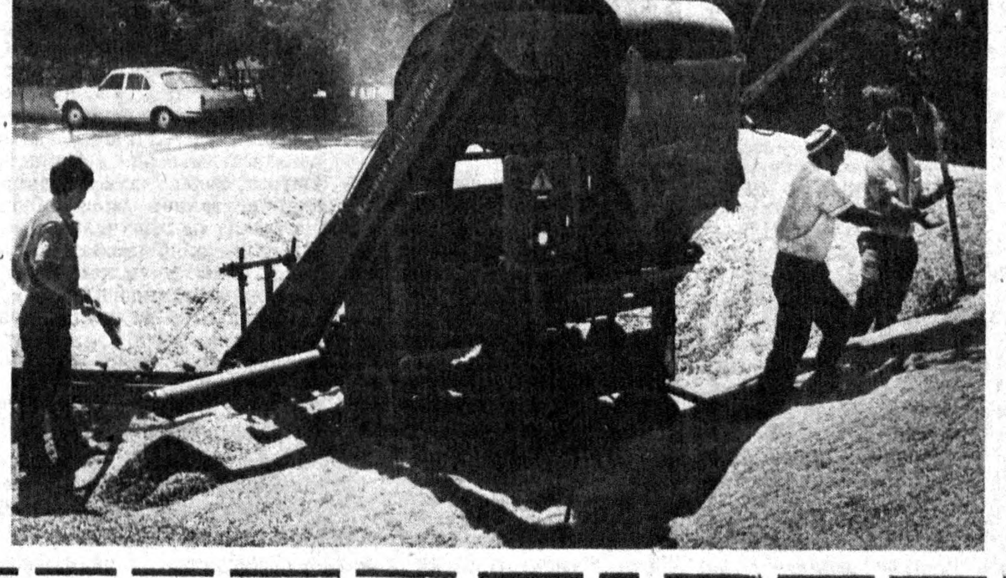
Томчида қўёш акс этганидек, булар ҳали дебоҳа ишлар. Яхши ниятли кўтулғу қадамлар кишлоқ меҳнат қилишида келажакка ишонч, умид туйғуларини уйғотади...