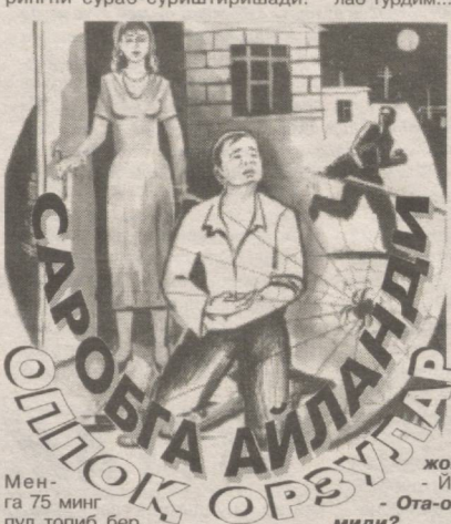
Менга 75 минг пул топиб бер.

Кетиб қолшидан кўриб, бошқа суриштирмадим. Ота-онаси ҳам жим... Орандан бир ой ўтиб, турилган куним арафасида: "Дили, уйдагиларинг келса тақинчоқларингни сўраб-суриштиришади.