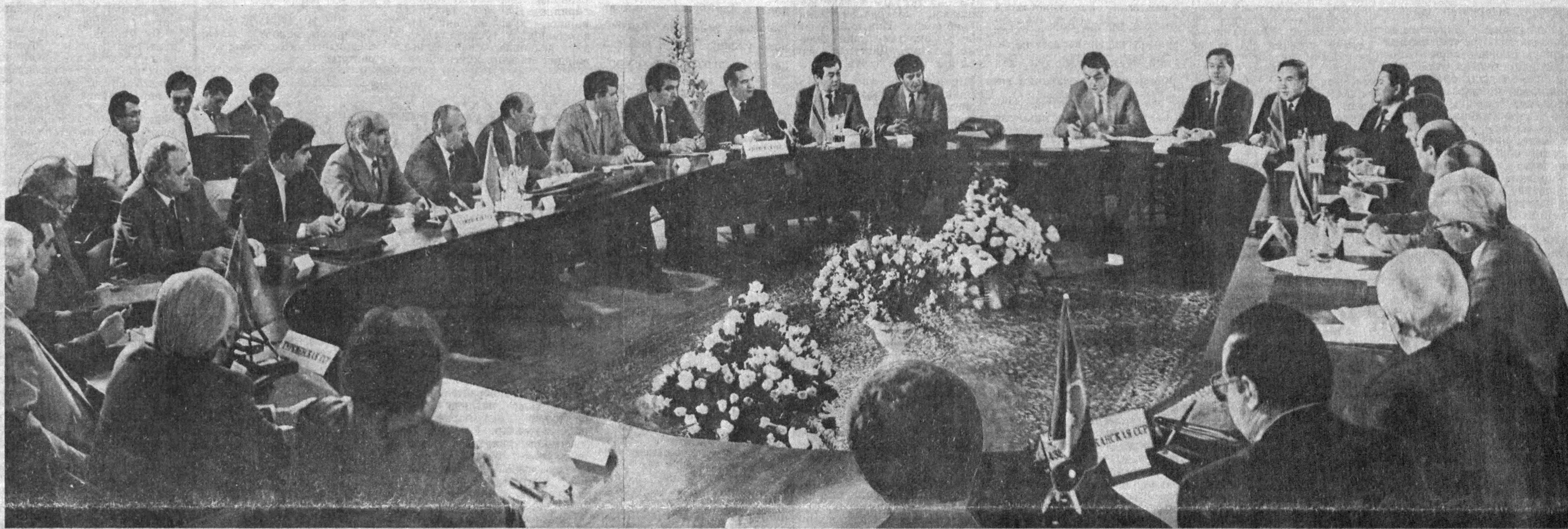
СУРАТДА: Кенгаш залда.

14 АВГУСТ КУНИ ЎРТА ОСИЁ РЕСПУБЛИКАЛАРИ ВА ҚОЗОҒИСТОН ПРЕЗИДЕНТЛАРИНИНГ УЧРАШУВИ ЎЗБЕКИСТОН ПОЙТАХТИДА МУҲИМ ҲУЖЖАТЛАРНИ ИМЗОЛАШ БИЛАН НИҲОЯСИГА ЕТДИ