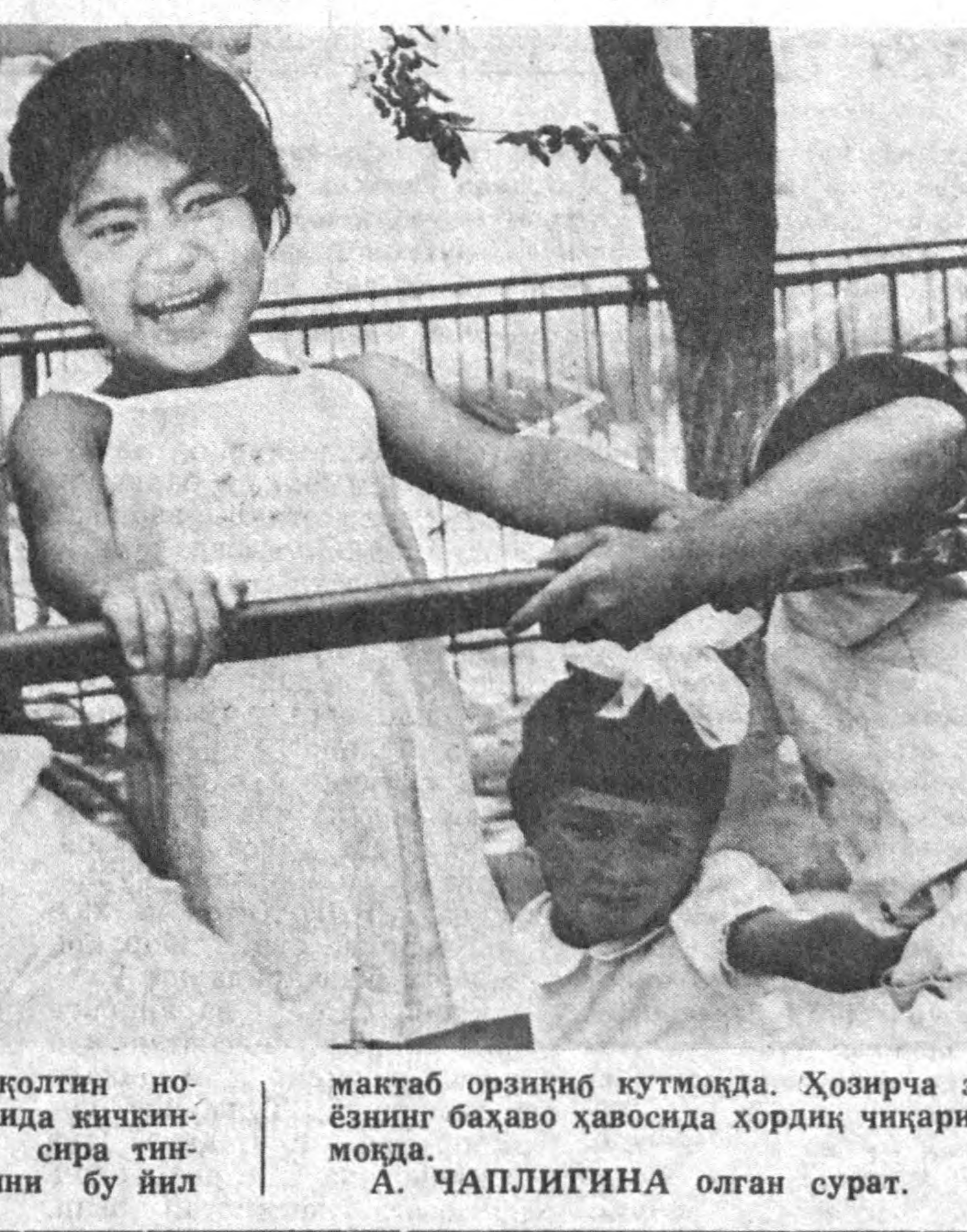
СИРДАРЕ ВИЛОЯТИ. Оқолтин ноҳиясигади 10-болалар боғчасида кичкинтойларнинг шодон кулуги сира тинмайди. Уларнинг кўпчилигини бу йил мактаб орзинқиб қутмоқда. Ҳўзирча эса ёнинг баҳова ҳўбасида хордиқ чичаршмоқда.

Ўзбекистонда олтин қазиб чиқарилмас экан! Бу йил қизим учинчи синфга боради. Бу — мактаб ислоҳоти шарофати. Чунки мен унинг ёшида бир синф қўйида ўқигандим. У буни билгача суюниб кетди ва мактабга ҳўзирлик қўришга аввалгидан ҳам жиддий киришди. Унинг алоҳида «Тошқирғи» биоанон бир неча дарсликларини олиб келдим. Бирингидида кўздан кечираётди, бир қизик жижатни кашф этдик. Ажабо, ўзбекистонда олтин қазиб чиқарилмас экан!