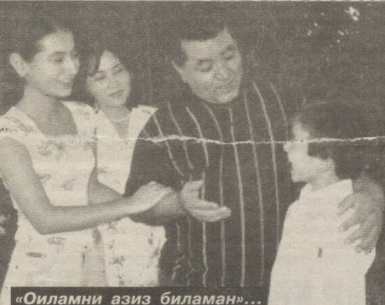
«Оиламни азиз биламан»...

- Сиз театрга доимо бош қаҳрамонларни, демоқчманки, ижобий ролларни ижро этасиз. Бу ижодингизда бирхиллик пайдо бўлишига олиб келмайдими?