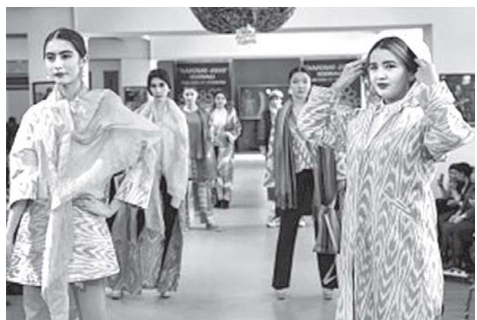
Подготовил Собир АЛИЕВ, «Народное слово».

Участники фестиваля посетили производственные предприятия Ферганской области и вместе с молодыми дизайнерами приняли участие в мастер-классах и «Круглых столах».