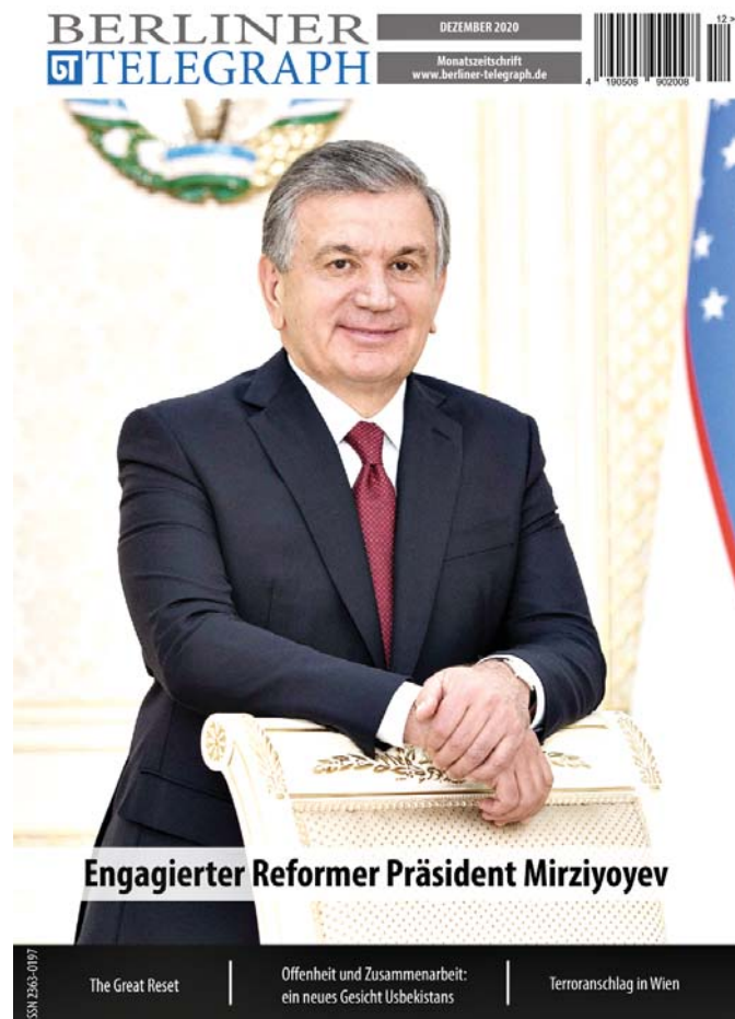
Engagierter Reformier Präsident Mirziyoyev

В декабрьском номере авторитетного ежемесячного немецкого журнала «Berliner Telegraph» опубликована статья, посвященная современному развитию Узбекистана