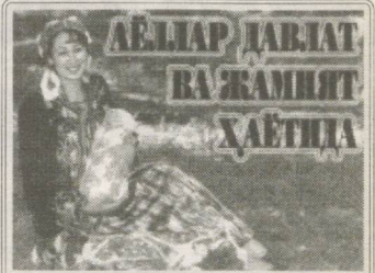
(Боши 33-36-37 сонларда.) Болалик ва оналикни ҳимоя қилувчи қонунчилик нимадан иборат?

1992 йил 9 декабрда Ўзбекистон Республикаси Олий Кенгаш Сессиясида Бола ҳуқуқлари тўғрисида Конвенция ратификация қилинди. Халқаро ҳамжамият олдида Ўзбекистон Республикаси уларни амалга оширишда ўзига жавобгарлик, қондаларига риоя қилишда мажбурият юклади.