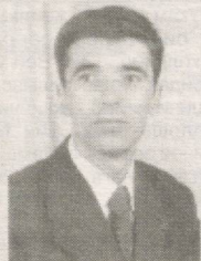
КҮНГИЛ МЕНГА БЕРДИ ЯНГИЛИК

Кўзларга қараб туриб мен, Хис этаман мукамалликни. У кўзларда ҳамма нарса бор; Кўнгили дейди: Йўқ, йўқ, йўқ! Кўзлар айтар бор кучинг билан, Мени забт эт, қайтма орқага. У кўзларда бунча маъно кўп,