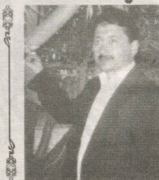
Юракка мушқу анбар, Яхшику карвалолдан.

Ё тавба нима бўлган, Чўчимайди малолдан.