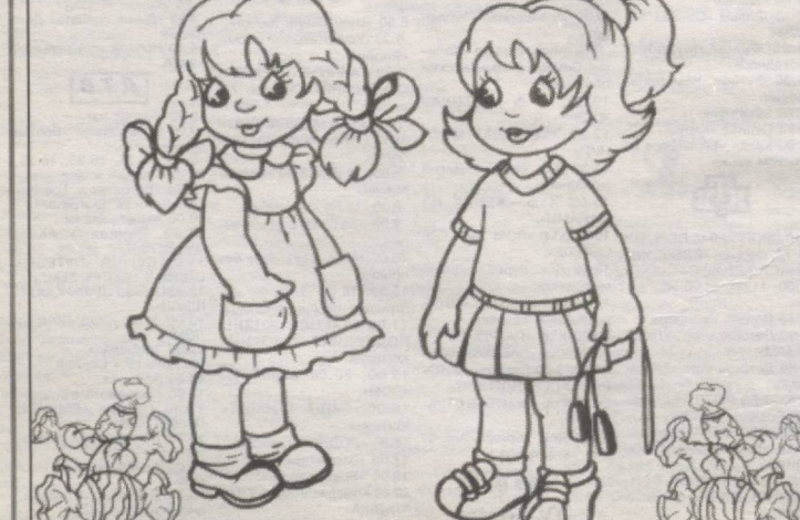
Salima va Halimada 4 donadan shirin konfet bor. Salimaga 2 dona, Halimaga esa yana bitta konfet suratini chizib qo'ying. Endi Salima va Halimalardagi konfetlar soni nechta bo'ldi? Suratlarini o'zingiz xohlagan rangda bo'yang.