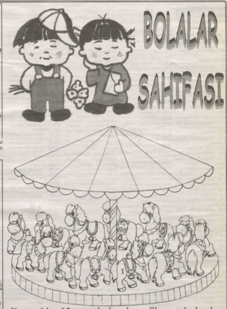
Karuselda 12ta otchalar bor. Shu otchalardan har uchtasini boshqa rangga bo'yang.