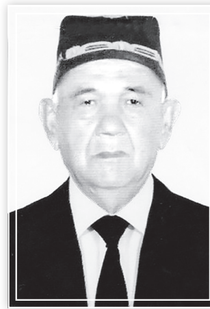
Сирдарё вилояти Шароф Рашидов номли туман газетасида муҳбир, 1977-1983 йилларда Пайариқ тумани қишлоқ ва сув ҳўжалиги бошқармасида муҳандис-энергетик бўлиб ишлади.