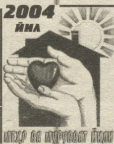
МЕҲР ВА МУРУВАТ ЙИЛИ