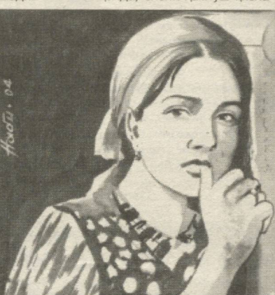
"Қайнотамни ҳурмат қиламай" - 5-сон