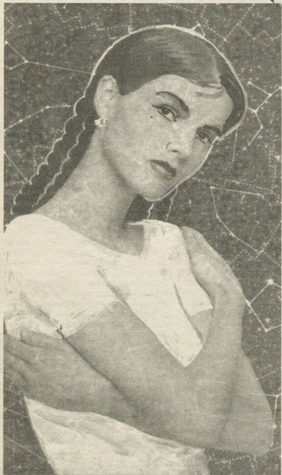
Ўтмишда табиблар табобатни чуқур билганлари ҳолда яхши мунажжим ҳам бўлишган. Улар юлдузларнинг башоратига қараб у ёки бу касалнинг сабабларини айтиб бера олганлар.

КҮЙ (21.3-20.4) Кўйларда модда алмас- шинуви яхши кечганли- ги учун кучли оғриқларни кўнда сезмайди. Улар грип- пнинг оғир турини ҳеч қандай асоратсиз ўтказганлари ҳолда, сал шамоллашдан ётиб қола- дилар. Бу бурждагиларга че- киш тўғри келмайди. Акс ҳолда бу бош оғриги ва қон босимининг ошиб кетишига олиб келади. Қизишиб кетиш ва зўриқиш соғлиққа фойда келтиривермайди. Аинқиса, юрақ қон томир хасталиги бор кишилар бу борада эҳтиёт бўлишлари керак. Чунки кўнгилсиз асоратлардан азият чекишлари мумкин.