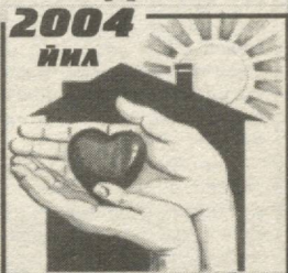
МЕҲР ВА МУРВОБАТ ЙИЛИ