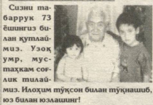
Умр ўллошнингиз ва фарзандларингиз.