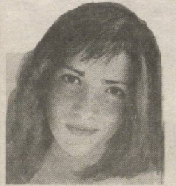
бошланиши билан кўпчилик киз, жувонларнинг

Ҳақиқатан ҳам баҳор келиши, кўёшли кунларнинг