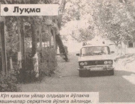
Қўп қаватли уйлар олдидаги йўлакча машиналар серкатнов йўлига айланди.

Жамиятимизнинг негизи бўлган маҳалла айнан мустақиллик йилларида хар бир юрдошимизни яратувчанлик, бунёдкорлик йўлида бирлаштирувчи, ҳамжихатликка етакловчи кучга айланди. Ростки, кўпчилик маҳаллаларда олиб борилаётган ободонлаштириш ишларини кўриб, баҳри-дилгингиз очилади. Қўп қаватли уйларнинг йўлакларини ён-атрофлари кишининг ҳавасини келтирадиган даражада саранжом-саришта. Уғил-қизларимизнинг спорт билан шуғулланиши учун деврли барча маҳаллаларда спорт майдончалари, аттракционлар қурилиб, фойдаланишга топширилмоқда. Хусусан Собир Раҳимов туманида ҳам бу борада кўп қаватли ишлар амалга оширилмоқда. Маҳаллалар обод бўлмоқда, маиший-маданий хизмат кўрсатиш муассасалари кўпаймоқда. Турар-жойларда болалар спорт майдончалари барпо этилмоқда.