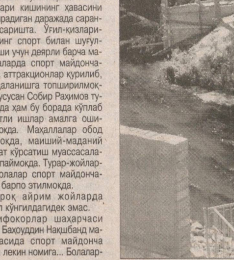
Зовур киргоғидаги молхона девори остидан ўтказилган қувур сув устига чиқариб қўйилган

Бироқ айрим жойларда ахвол кўнглидагидек эмас. Шифокорлар шаҳарчаси Ҳожа Бақоуддин Нақшбанд маҳалласида спорт майдонча бору, лекин номига... Болалар-