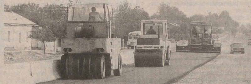
Суратларда: ҳудудий шўба корхона йўлсозлари фаолиятдан лавҳалар.

Келгуси йил эртақлар шаҳри Самарқанд ўзининг 2750 йиллик юбилейини нишонлайди. Шу мақсадда шаҳар йўллари янада ободонлаштирилиб, кўркамлаштирилмоқда. Серкатнов ва тирбанд йўллар кенгайтирилмоқда. Самарқандлик йўлсозлар томонидан ана қўшимча учта йўл фойдаланишга топширилади.