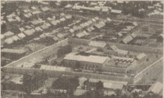
Самолётдан олинган сурат. (Ўртада қамқоҳонага айлантирилган Одина жоме масжиди).

— Дастлаб биз ҳам шундай ўйларга борганмиз, — дейди асосий ишларни бажарган «Бухоро бунёдкор таъмир» масъулияти чекланган жамияти устаси Ҳасан Умаров. — Аммо ихлос билан меҳнат