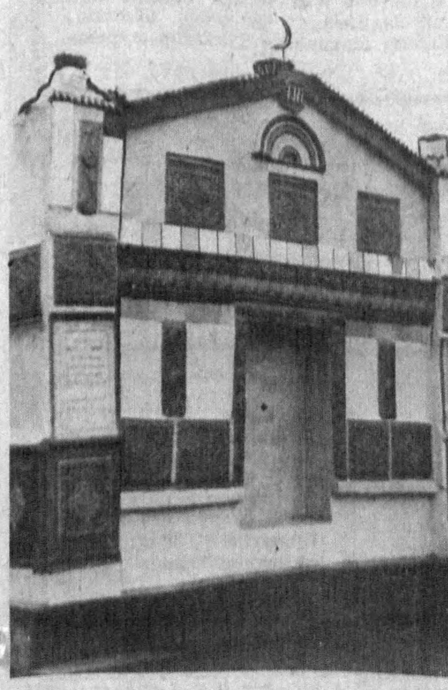
Хувайдо қабрининг ҳозирги кўриниши.

уламоларнинг қолоқ, жоҳил қисми орасида кучли норозилик уйғотди. Қўчада бўлмасин, маъракада бўлмасин, дин номидан гапириб, оммани талашга чоғланган илмсиз сохта қори-номлар, болалар умрини беҳуда ўтказиб иқтидорсиз мактабдорларни шoir мактабда дарс бериш пайтида ҳам, хонақоҳдаги воқеонлик чоғи ҳам аёвсиз фош этди.