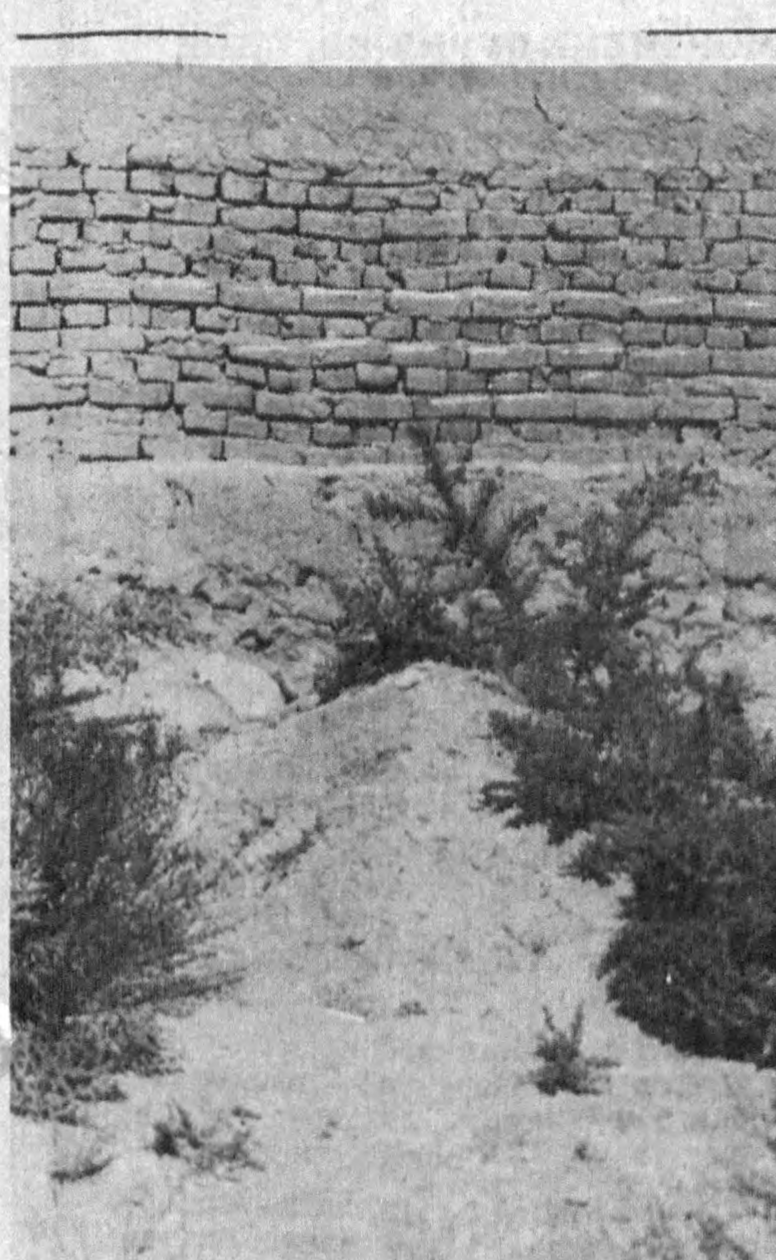
Хувайдо қабрининг 1955 йилдаги кўриниши.

Отаншарф шoir бутун Туркистонга доғру соғди. Айни вақтда, ёзма манбалардан маълум бўлишича, унинг иккинчи мақсади жаҳолат ва саводсизликка маҳкум этилган деҳқонлар оммасига маърифат элтиш бўлган. Бу Хувайдо ҳаётининг ҳали нам ўрганилган, адабиётчилар ва тарихчилар эътиборига лойиқ нуқтаасидир. Ўзбек маърифатпарварлиги тарихида Хувайдонинг ўз ўрни бор. Хувайдо ўзбек шoirлари ичда биринчи олис қишлоқда мактаб очган ва узоқ йиллар қишлоқ болаларига хат-савод ўргатиш билан шуғулланган. Ўз ўқувчилари учун таълим-тарбия, ахлоқий-дидактик мазмундаги «Роҳати дил» манзумасини ёзган. Айрим маълумотларга қараганда, Хувайдонинг таълим бериш усули ҳам замондош домлаларга нисбатан бирмунча илғор, янгиликларга бой бўлган. Маълумки, XVIII асрда мадраса ва мактабларда дарсилар асосан араб-форс тилларида битилган бўларди. Хувайдо, юқорида айтганимиздек, ўзбек тилида ахлоқий-тарбиявий китоблар ёзган. Аввало наср билан ёзилган, кейин ўзи назм-