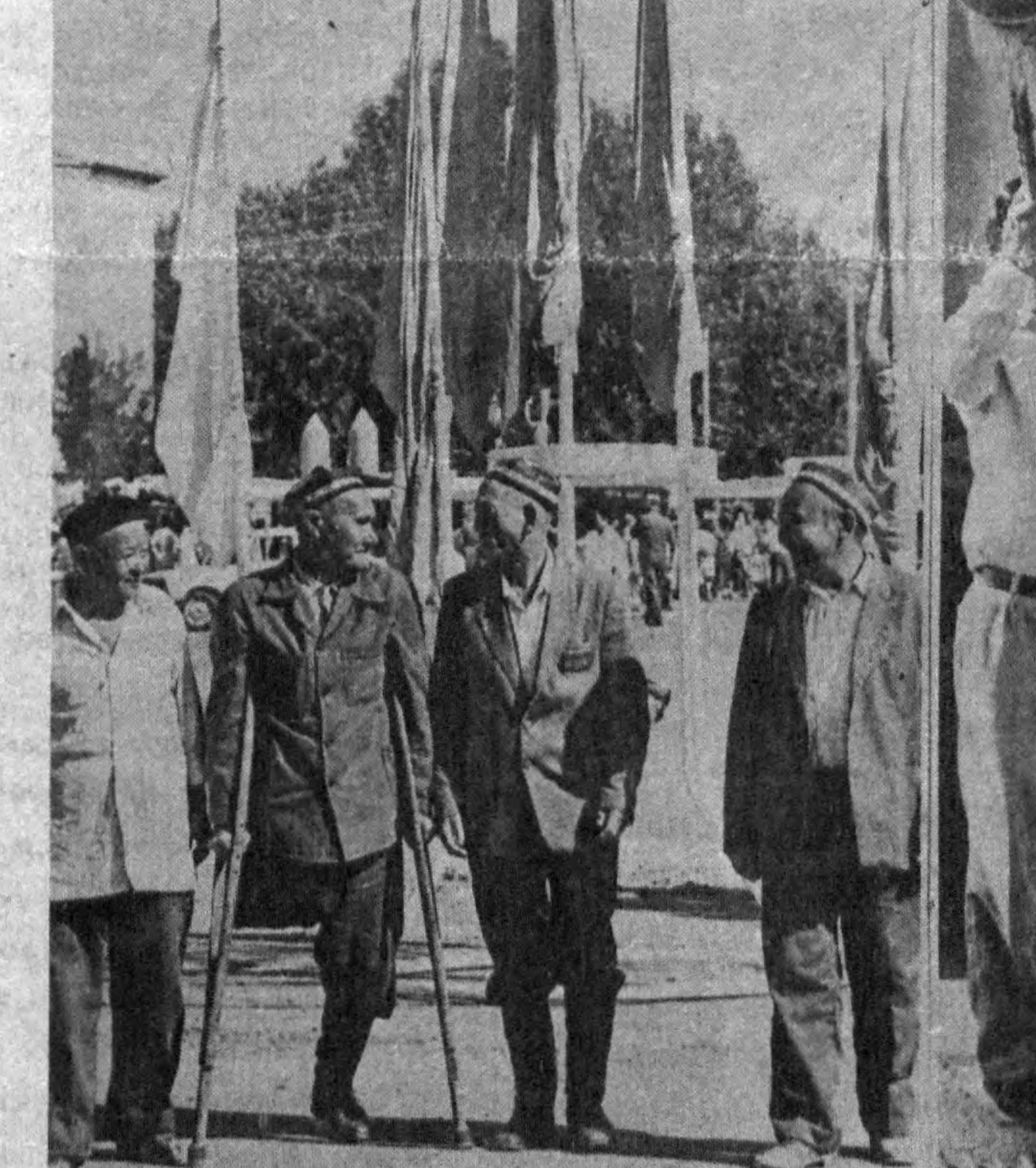
● Суратда: Қашқадарё вилоятининг Қарши шаҳрида байрам тантаналари.

Қораўзақ ва Кегейли районларида мева-сabboот экинлари ҳосил байрами катта муваффақият билан ўтди. Нукусда, бошқа маҳаллий ҳалқ сайллари бўлди, тўпланганлар хузурида бадий ҳаваскорлик жамоалари, санъат усталари концертлар қўйиб беришди. Байрам Қарши шаҳрида, Қаш-