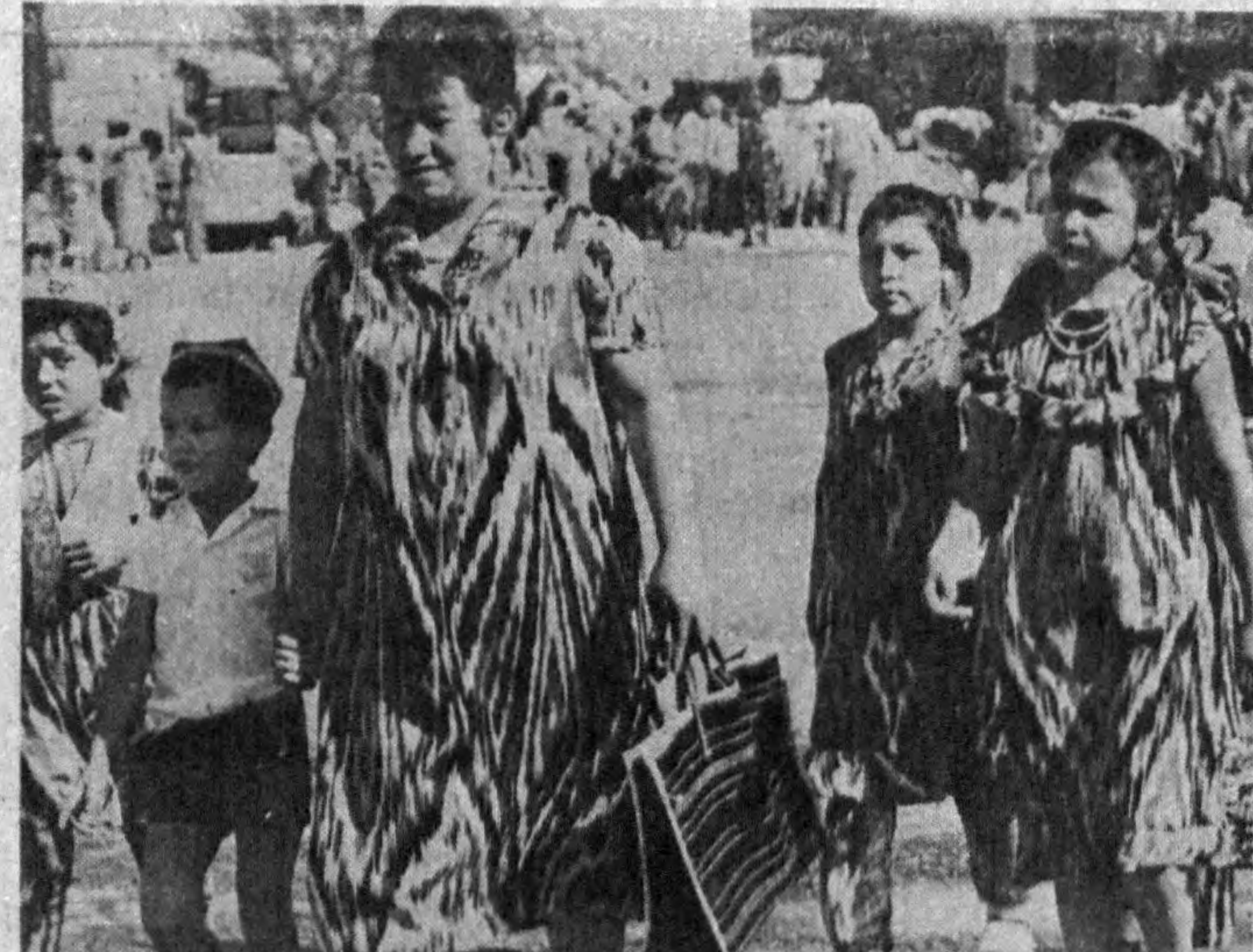
● Суратда: пойтахт вилоятининг Оржоникидзе райониде байрам тантаналари.

Халқлар дўстлиги орденли Тошкент деҳқончилик дорифунунининг марказий майдониде митинг бўлди. Сўзга чиққан кишилар тўпланганларни