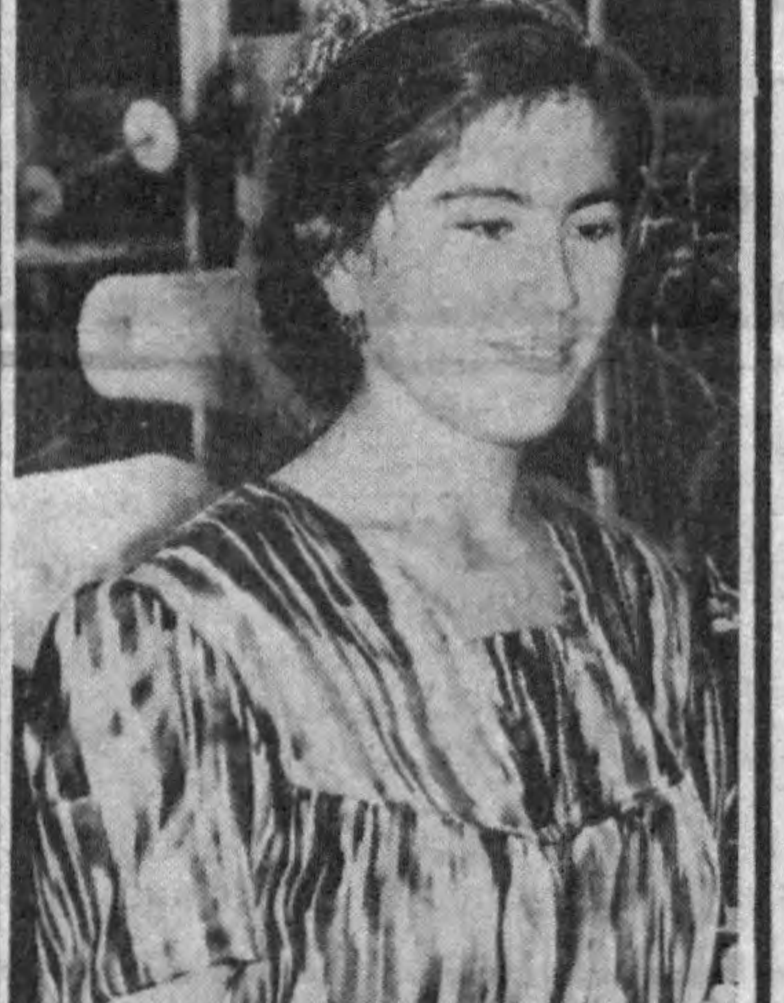
Қўрғонтепа районидagi Ильин номили пайпоқ тўқиш фабрикасида меҳнат аҳлининг юктимоний шартлоғини ахшилатишга алоҳида эътибор берилди.

Меҳнаткашлар манфаатларини ўйлаб қилинаётган бундай харажатлар ўз натижасини берди — корхона аҳли тақлим пайпоқ махсулотларини ишлаб чиқаришни кўпайтирмоқда.