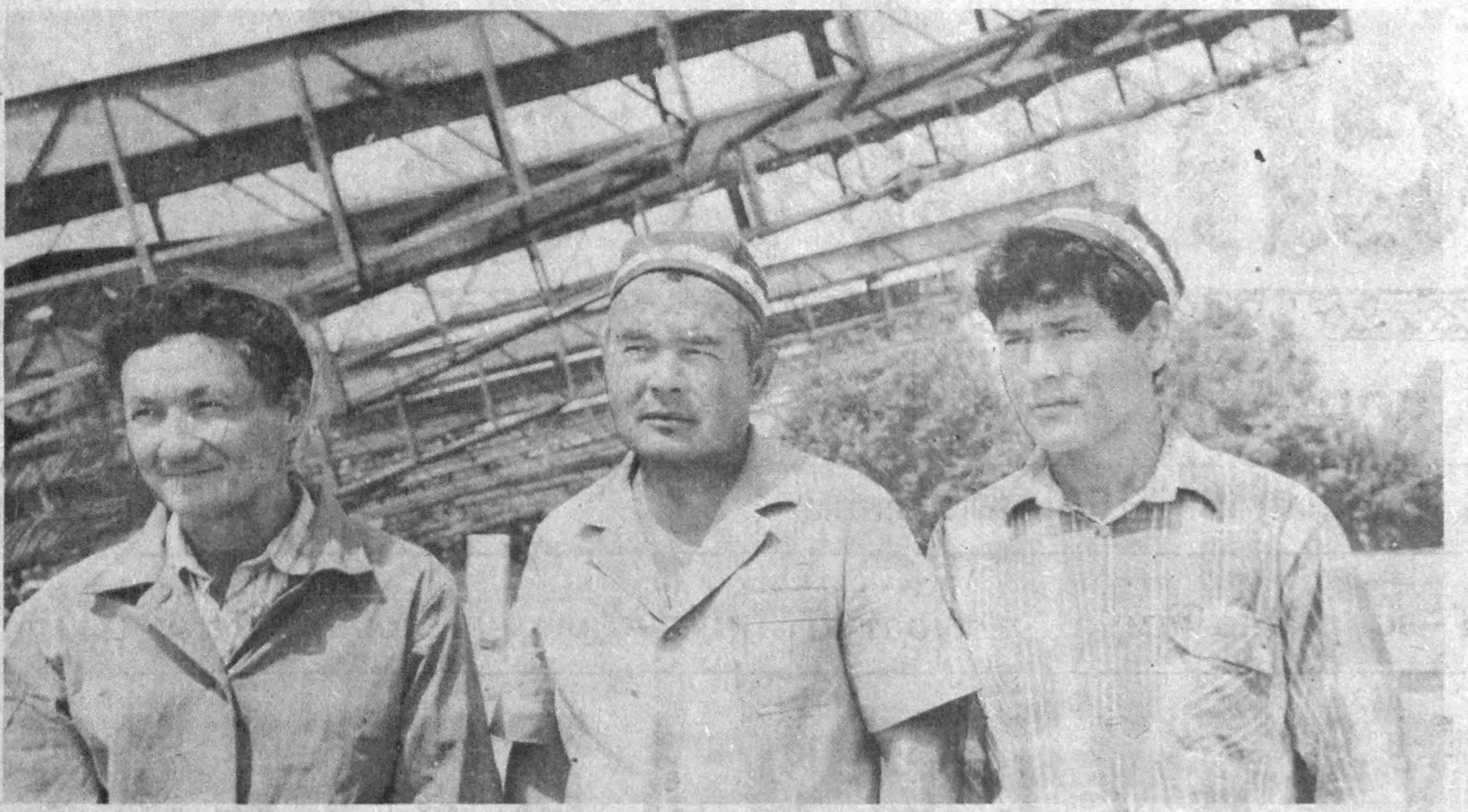
К. Турсунов олган сурат.

Одатда душанба кунини Тошкент театрида дам олиш кунини билди. Аммо кунини неча саҳна санъатимизнинг етакчи жамоаларидан бири Ҳамза номидagi Ленин орденли Ўзбек давлат Академик драма театри одамлар билан гавжум бўлди. Театр ижодий жамоаси дам олиш кунини қадрдонлар, — маданият арбоблари, қалам аҳллари, санъат муҳлислари билан Ўзбекистон Республикаси мустақиллигини байрам қилди. Меҳмонлар қарнай-сурнайлар билан кутиб олди. Ўртага дастурхон ёзилди. Мустақилликка бағишланган шеър ўқилди. Театр асосчилари, унинг шаклланиши ва раванлигига муносиб ҳисса қўшган марҳумлар ёдга олинди. Ўзининг янги мавсумини бошлаган танқид театрнинг бу хайрли ишга иштирокчилари.