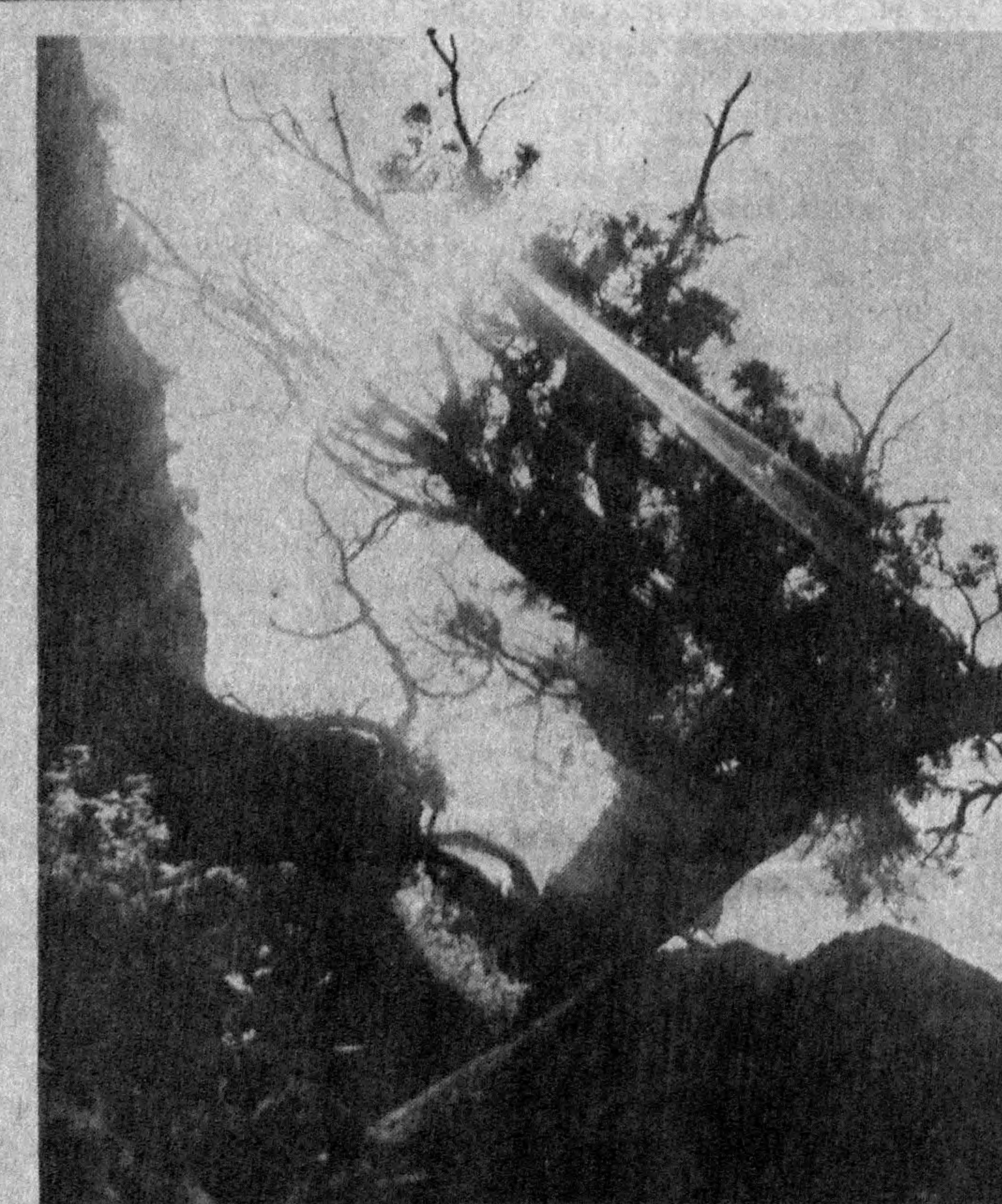
Сумбула кўёши ҳам киши қалбига илқилик, ором бахш этади.