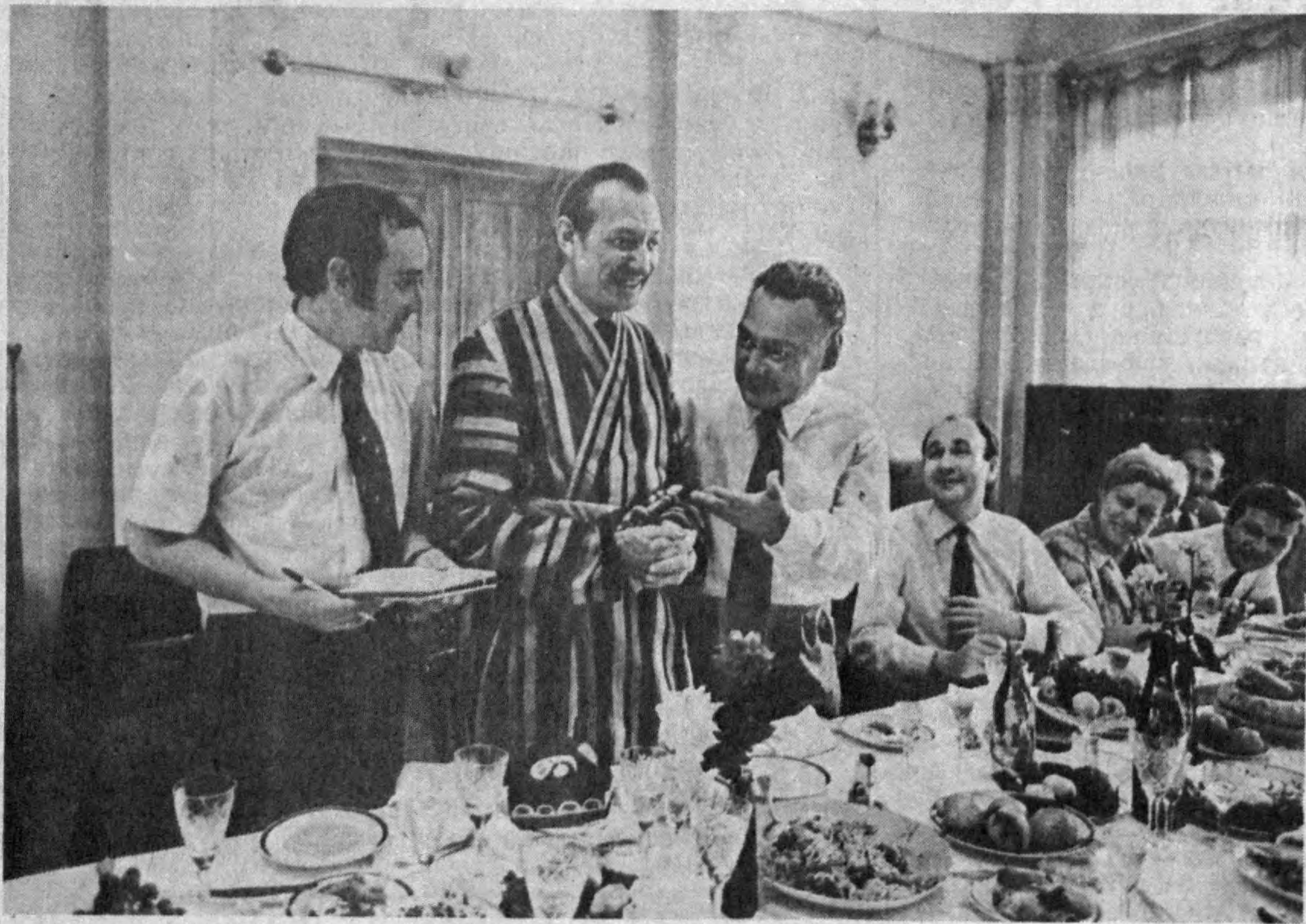
Бирлашган Миллатлар Ташкилоти Бош котиби Курт Вальдхайм 1972 йилда Ўзбекистонга дўстлик ташрифи билан келган эди.