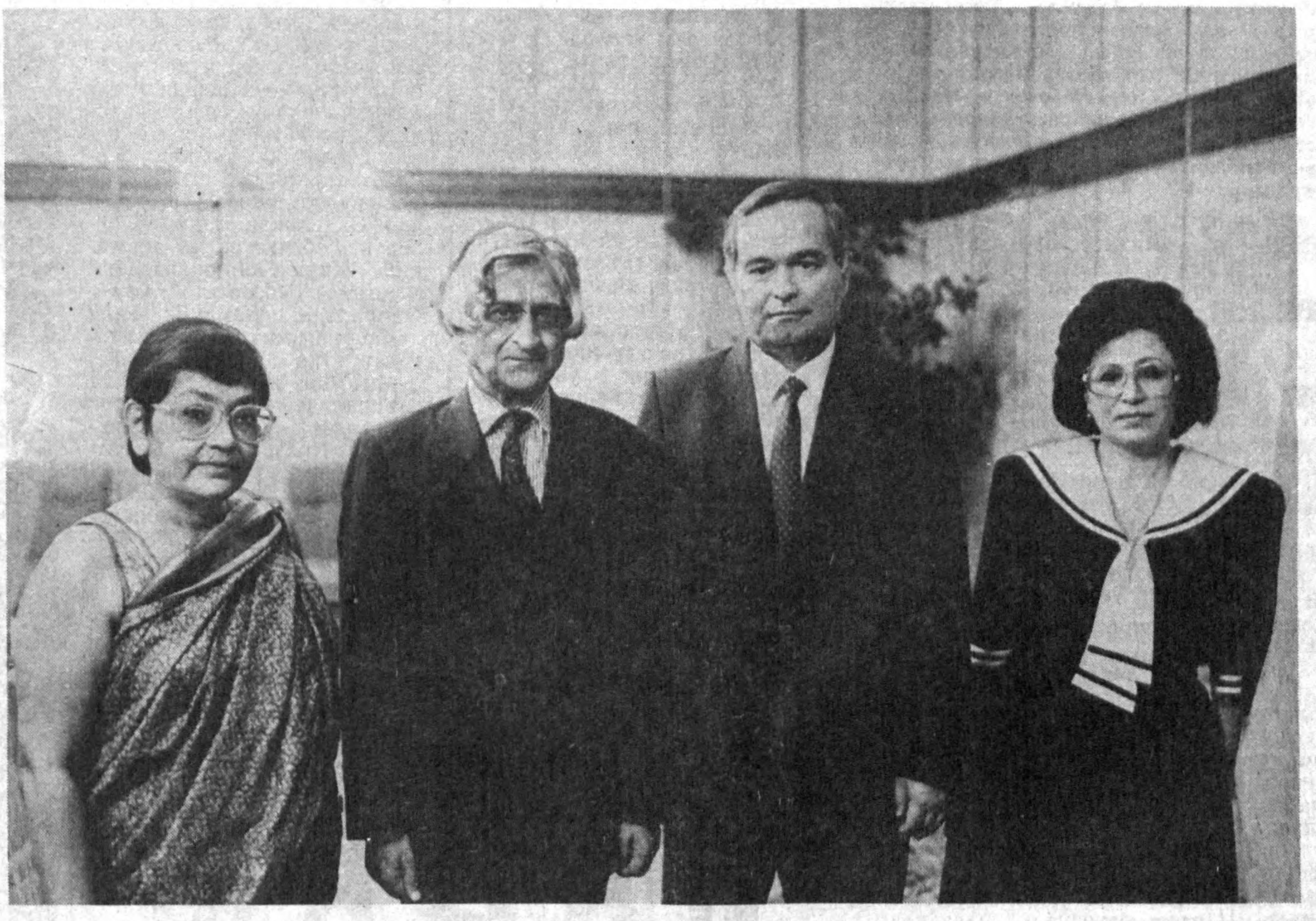
СУРАТДА: учрашу пайти. Р. ШАГАЕВ олган сурат. [ЎЗАГА].

Ўзбекистон Президентини Ўртоқ ИСЛОМ АБДУҒАНИЕВИЧ ҚАРИМОВГА Мен Сизга Ўзбекистон Республикасининг ўз мустақиллигини кўлга киритишда қилган хизматлариниз учун Сизларга ноҳиясидаги спорт жихозлари заводи ишчи-эриштининг раивақи йўлида ҳаммамиз бир жон, бир тан бўлиб ишлабёрамиз, демокдалар заводимиз жамоаси аъзолари.